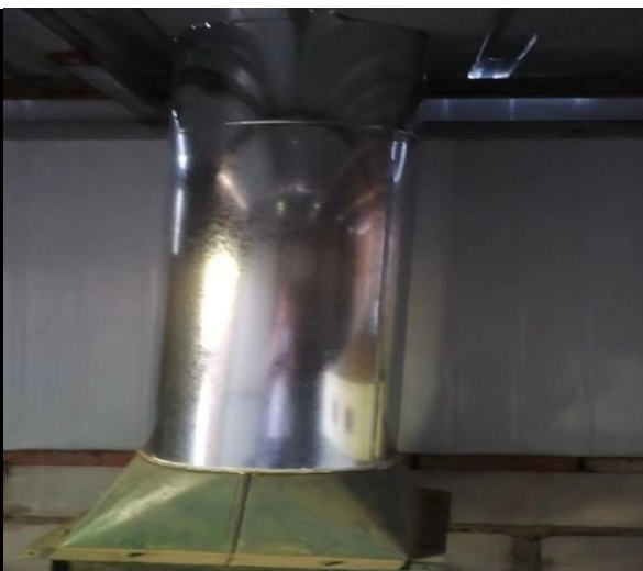
工艺废气排气筒及 UV 光氧催化装置