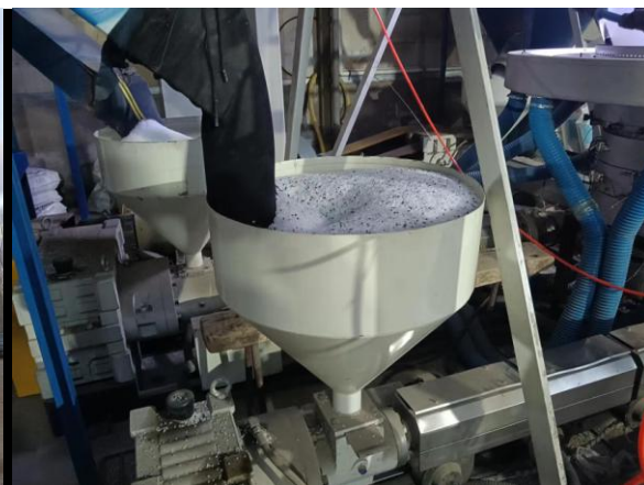
生产车间及进料口