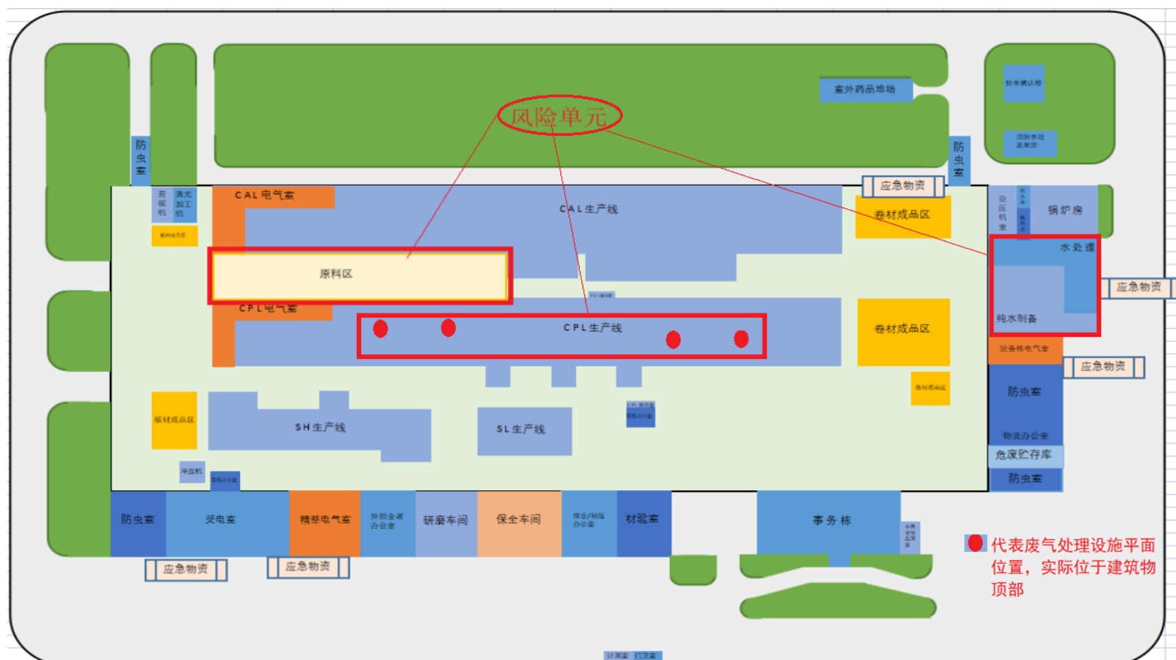
图4-4风险单元分布图