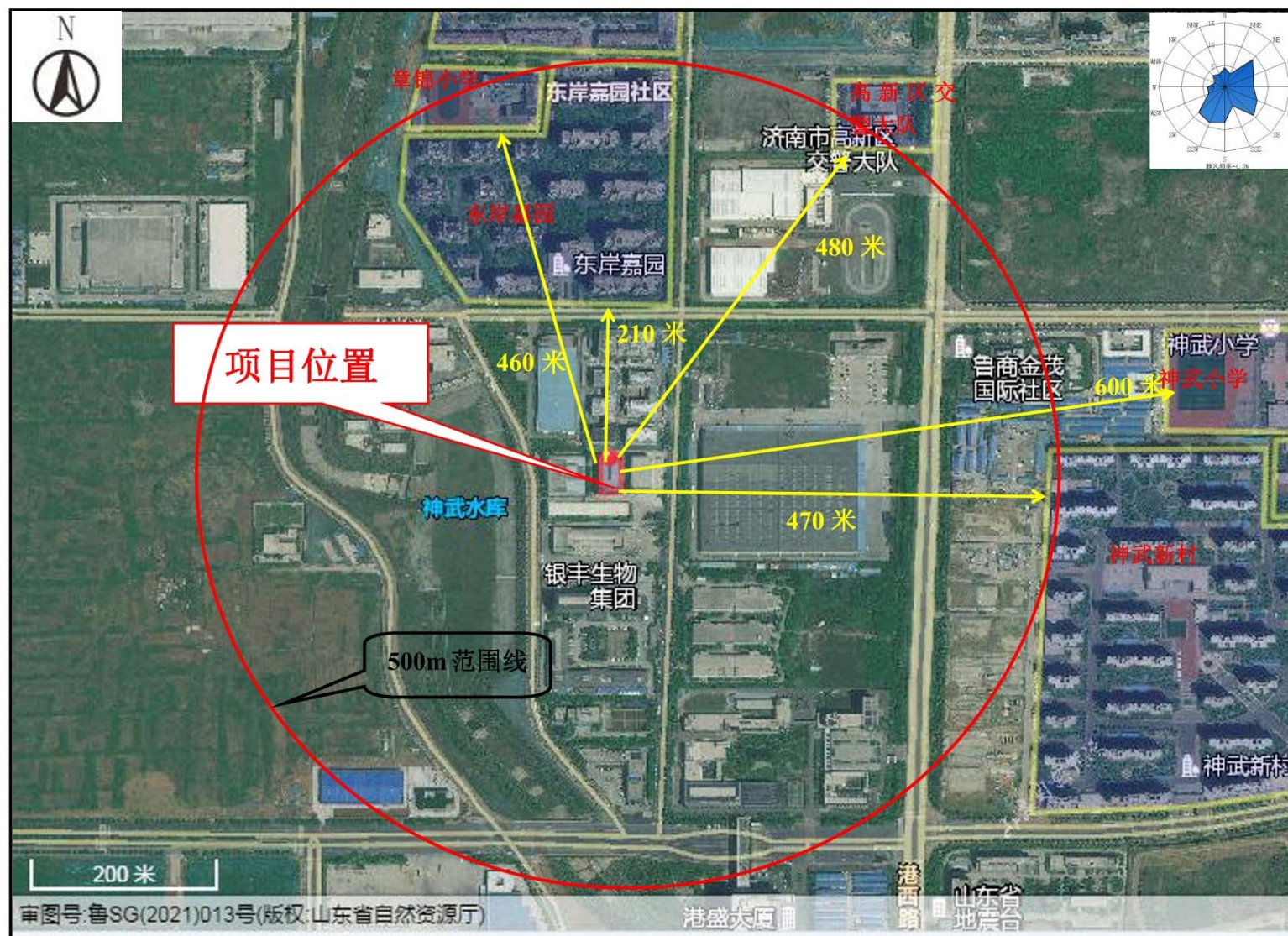
附图 2 项目周边情况图