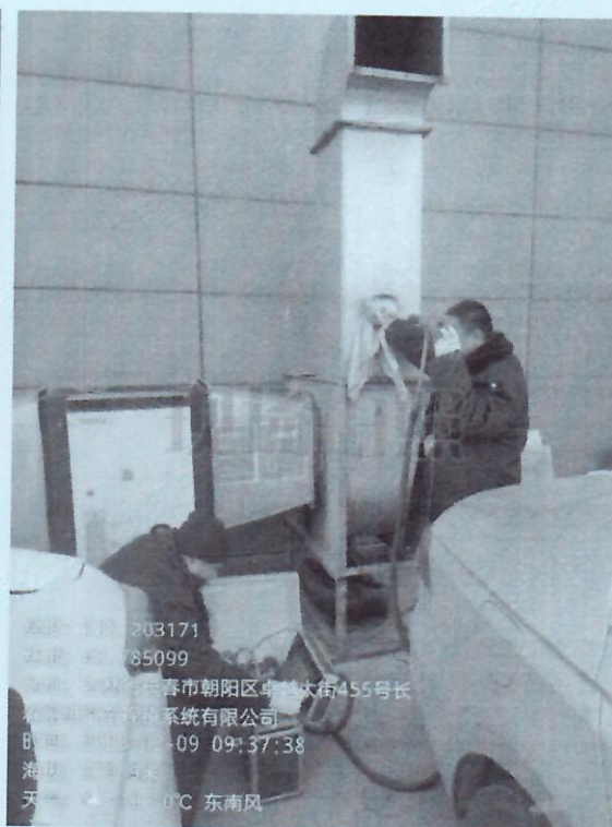
附图2 油烟废气采样图