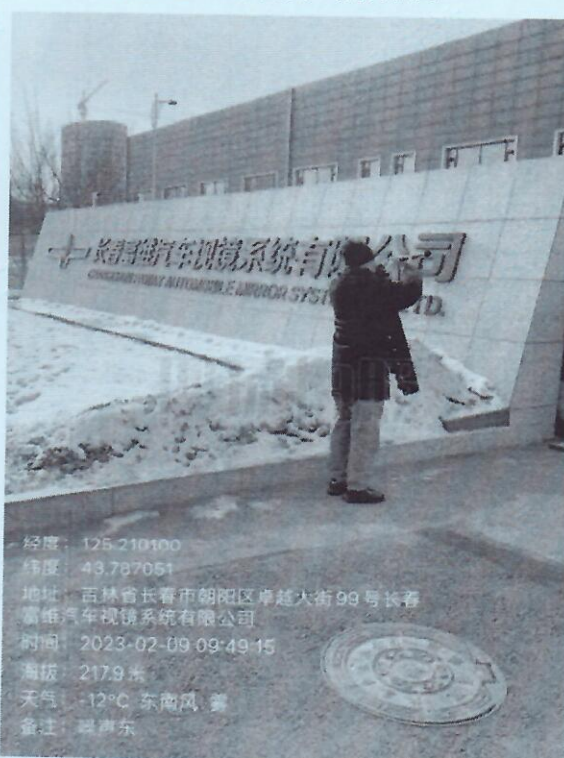
附图4 噪声现场检测图