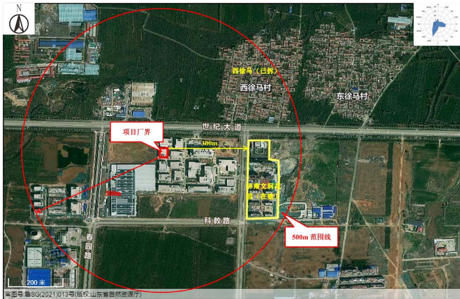
附图2 项目周边情况图