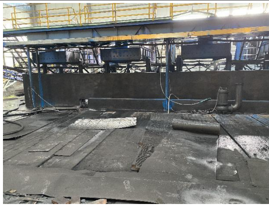
循环水池及事故水池