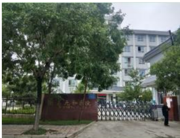
项目门诊住院综合楼