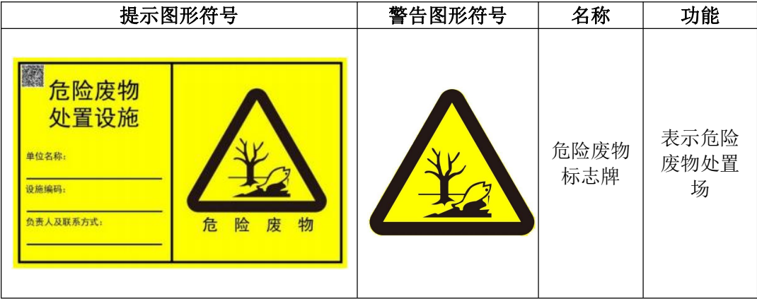
表 4-9 图形标志

项目总投资 26.67 万元，环保投资为 26.67 万元，占总投资的 100%。具体环保投资项目参见表 4-10。