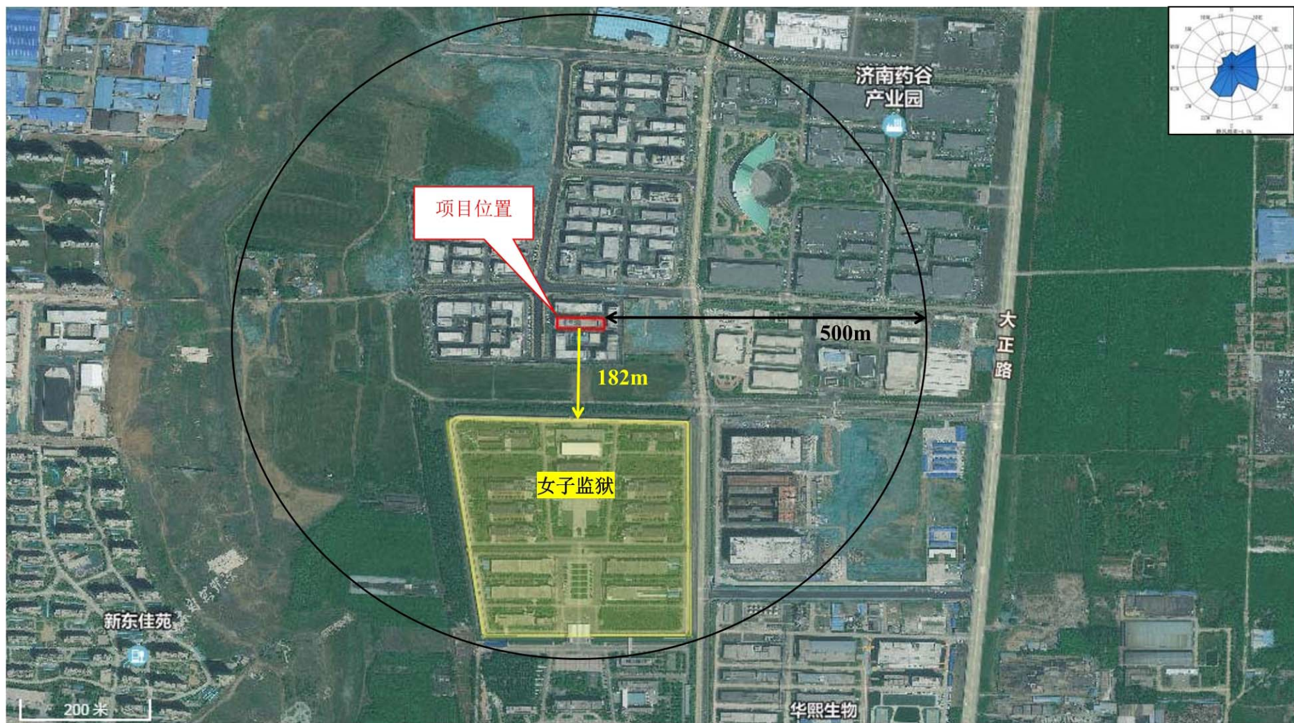
附图2 项目周边情况图