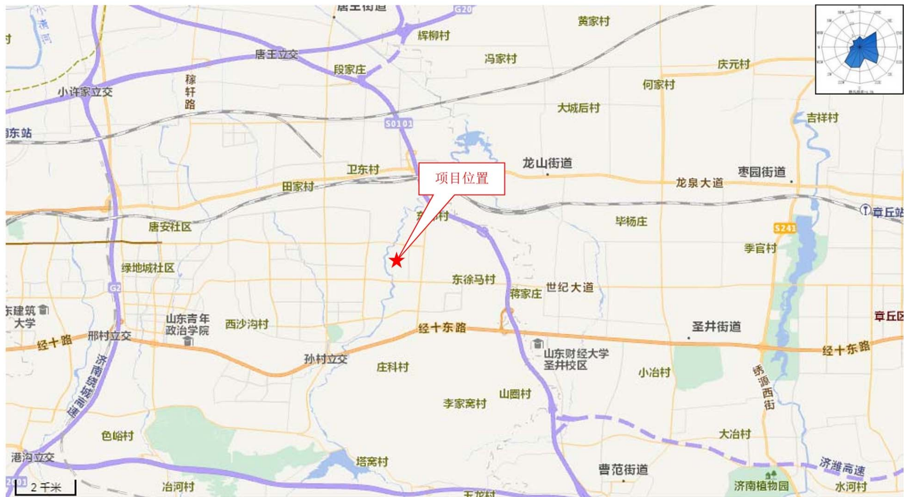
附图1 项目地理位置图