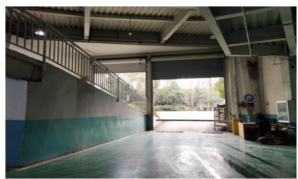
十六、消防安全通道