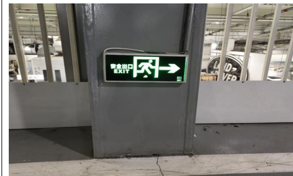
十五、安全出口标识牌