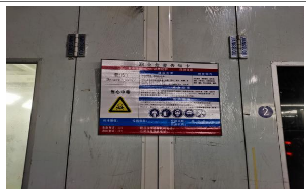
十、职业危害告知卡