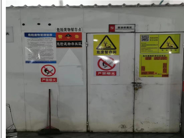
十一、危险废物暂存间