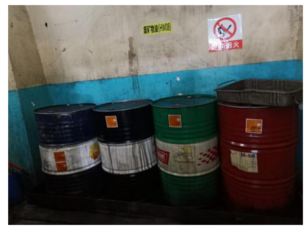
十二、危险废物暂存间内托盘防渗