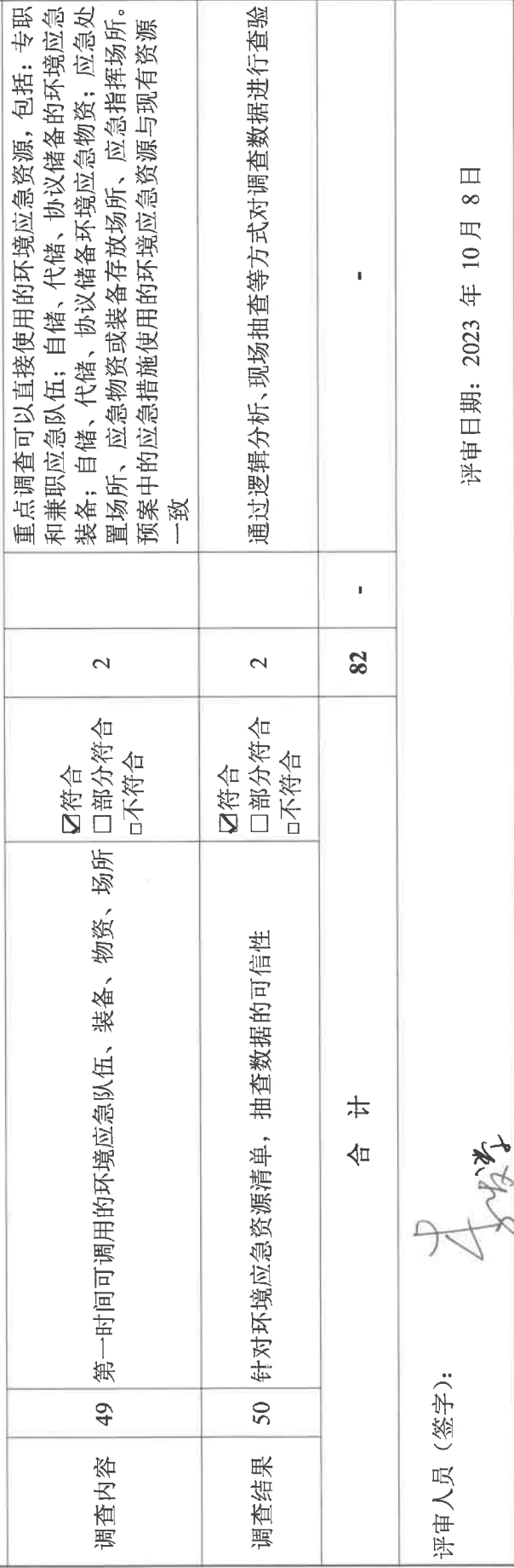
环境应急资源调查报告（表）

注：1.符合，指的是评审专家判定某一项指标所涉及的内容能够反映制定环境应急预案的企业开展了该项工作，且工作全面、深入、质量高；部分符合，指的是评审专家判定企业开展了该项工作，但工作不全面、不深入或质量不高；不符合，指的是评审人员判定企业未开展该项工作，或工作有重大疏漏、流于形式或质量差。