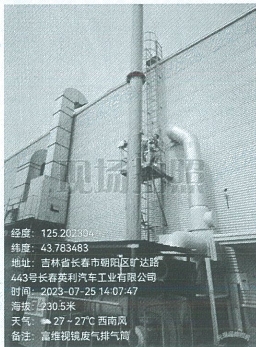
附图3 有组织废气采样