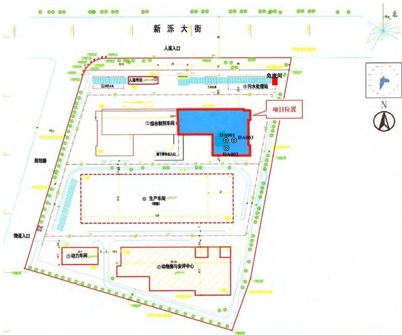
附图3-1 项目厂区平面布置图