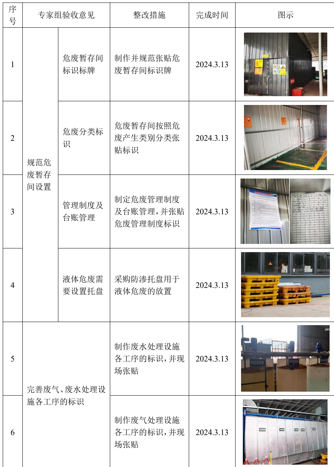
表1 项目竣工环保验收专家组意见整改情况一览表