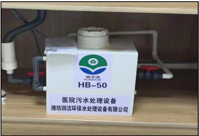
图4-1 医疗废水处理设施