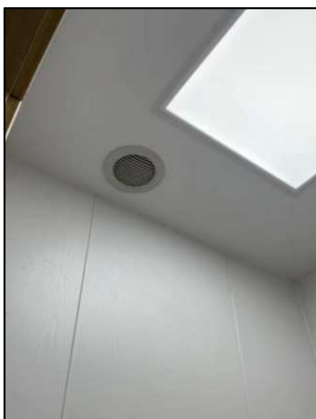
图4-2 废气通风排气设施