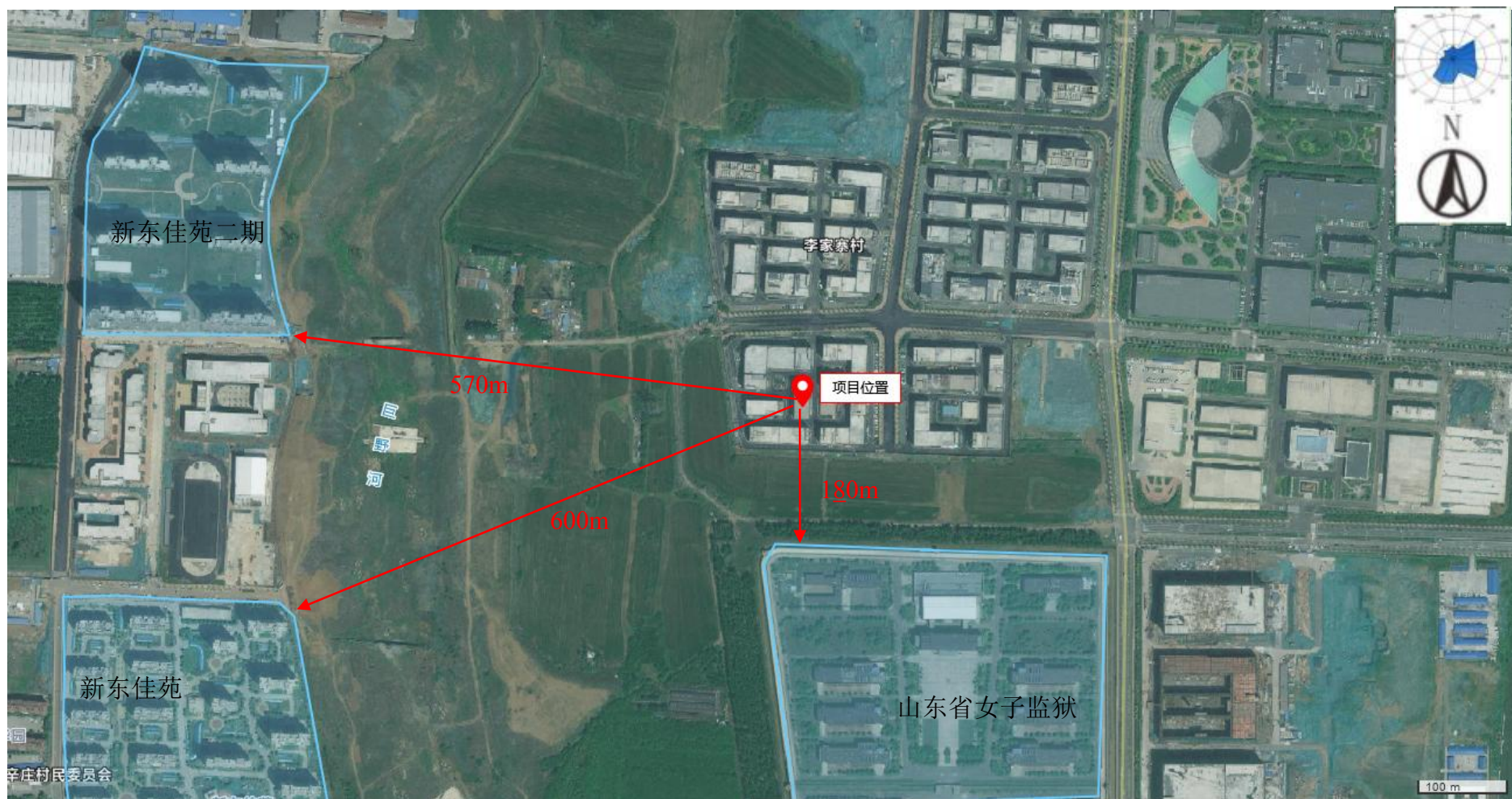
附图2 项目周边情况图