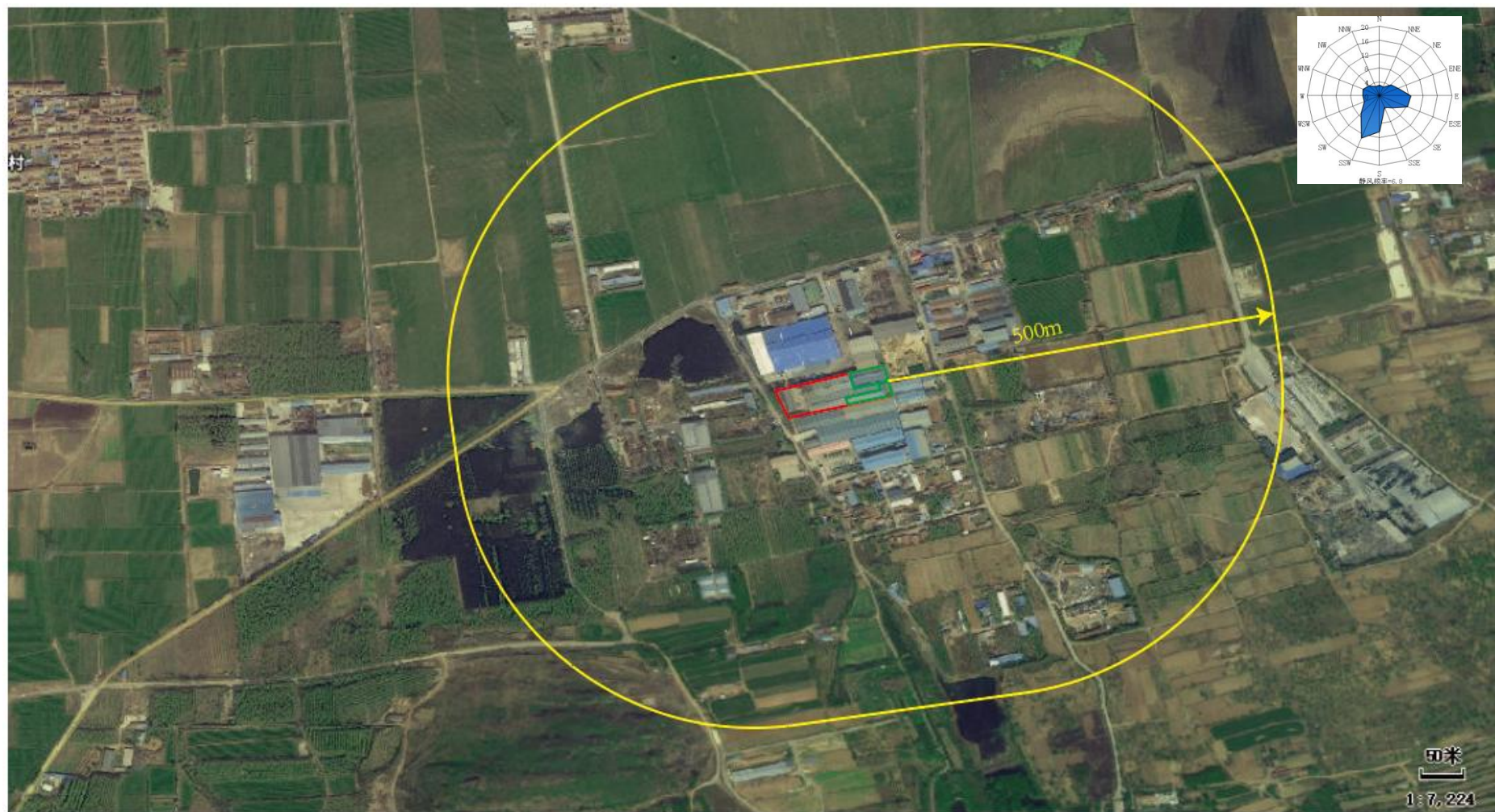
附图 2 项目周边环境及敏感目标图