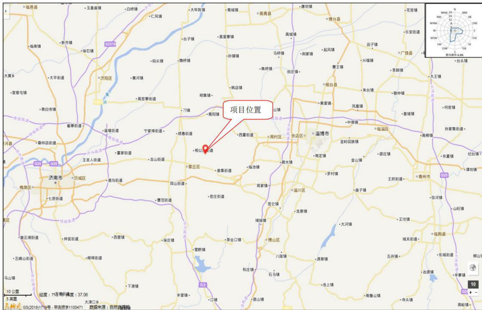
附图 1 项目地理位置图