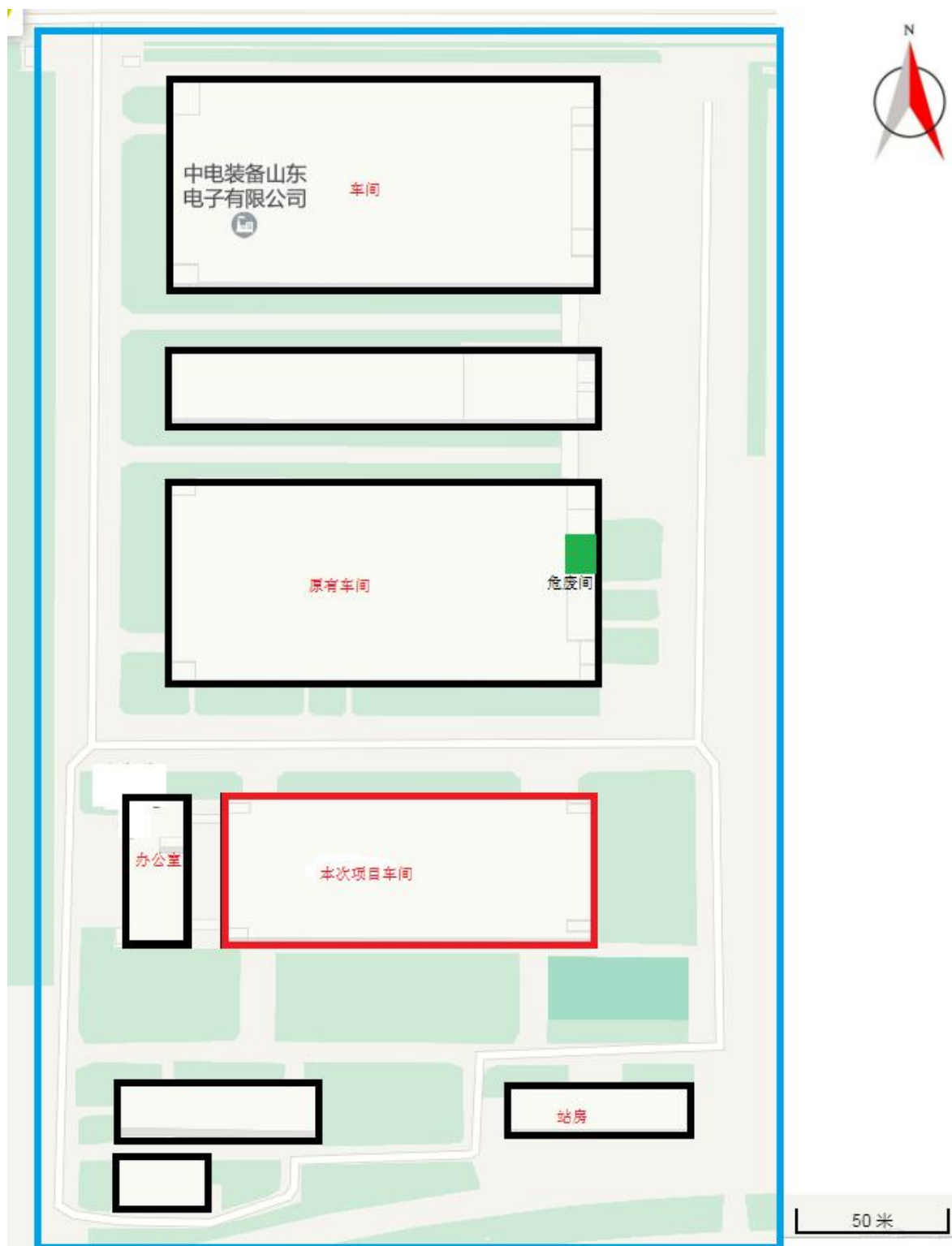
附图3-1 项目厂区平面布置图