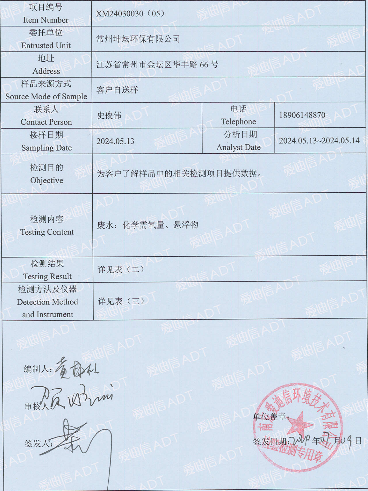
表（一）项目概况说明