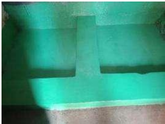
危废暂存间防渗池