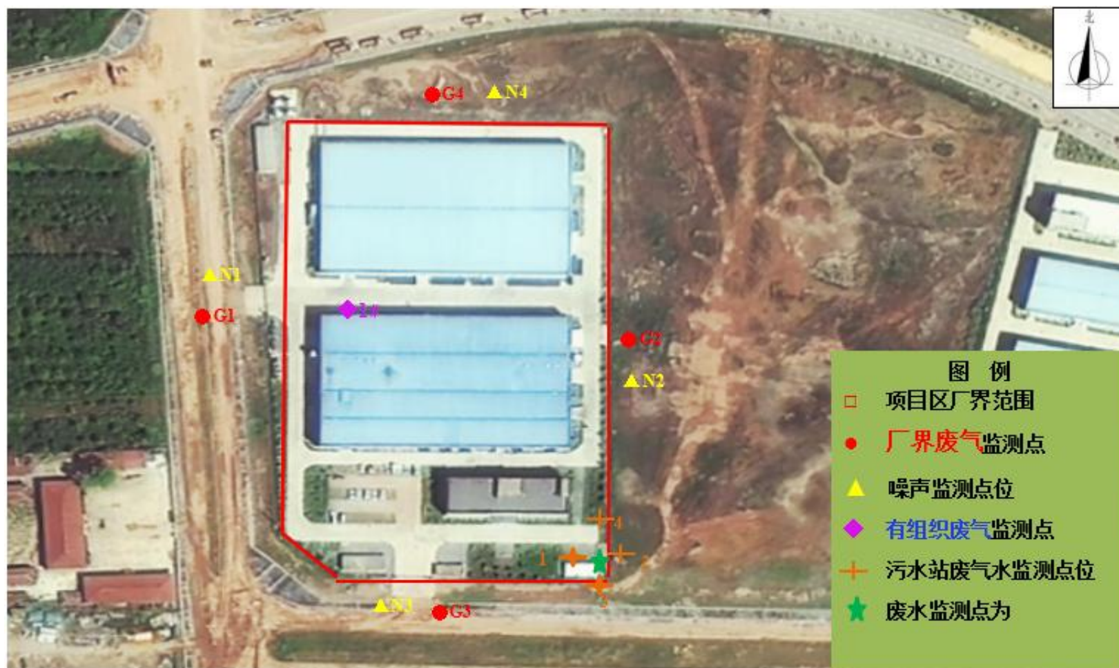
图 6-1 监测点位图