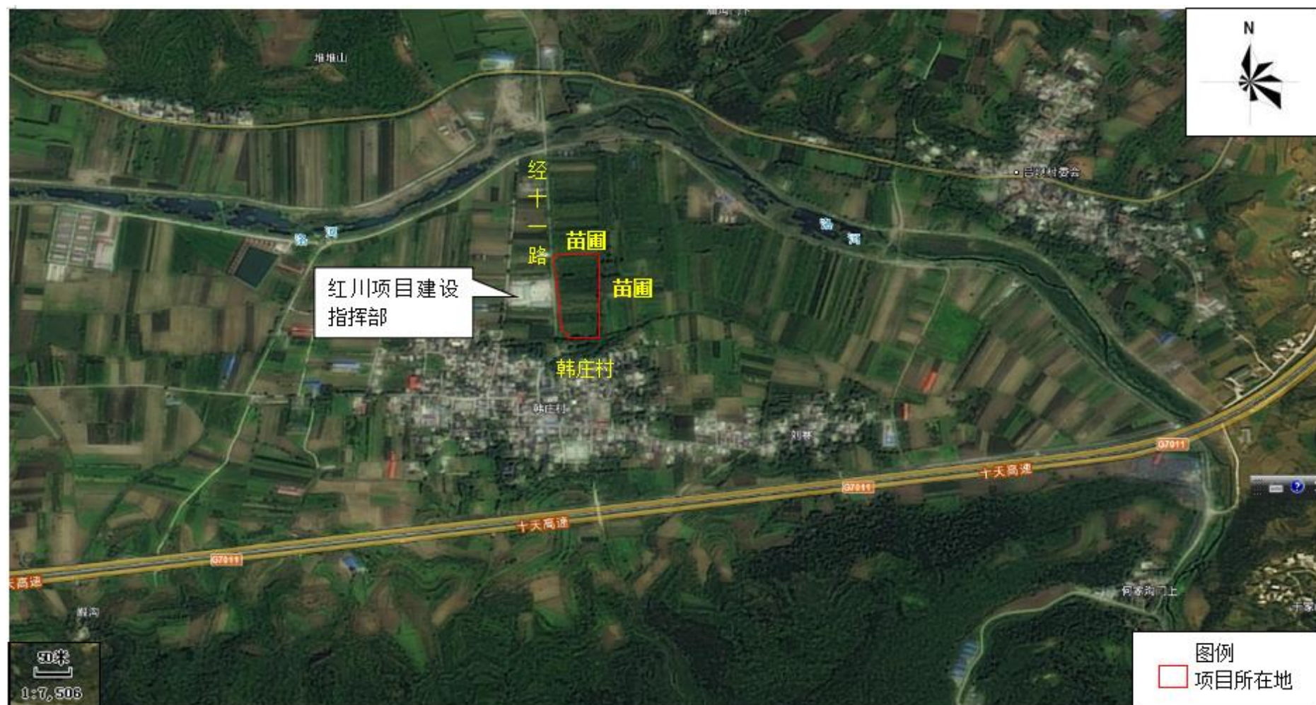
图 4-2 四邻关系图