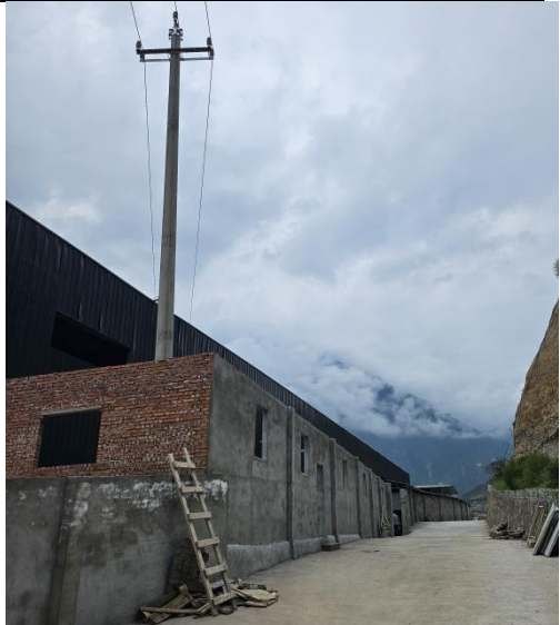
厂区现状及已建厂内道路