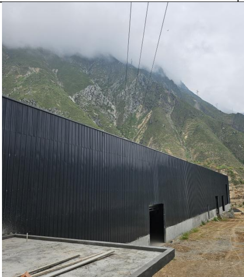
已建屠宰车间（外部）