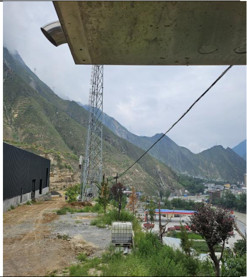
厂区东南侧元茨头加油站