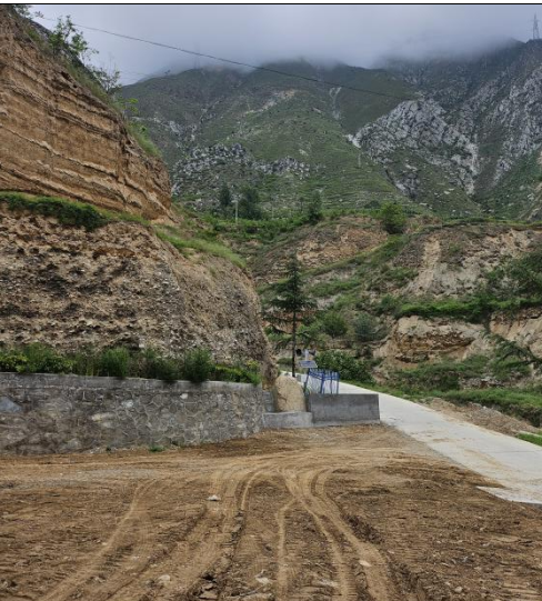
进厂道路及北侧山体