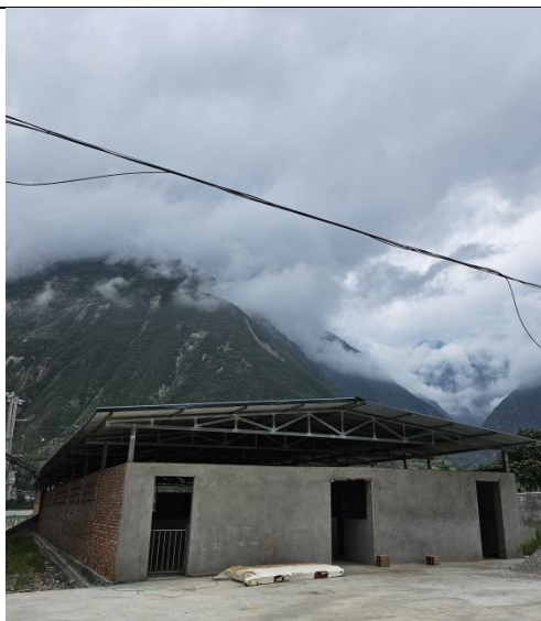
已建待宰车间（外部）