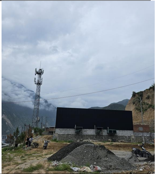
厂区现状及已建屠宰车间