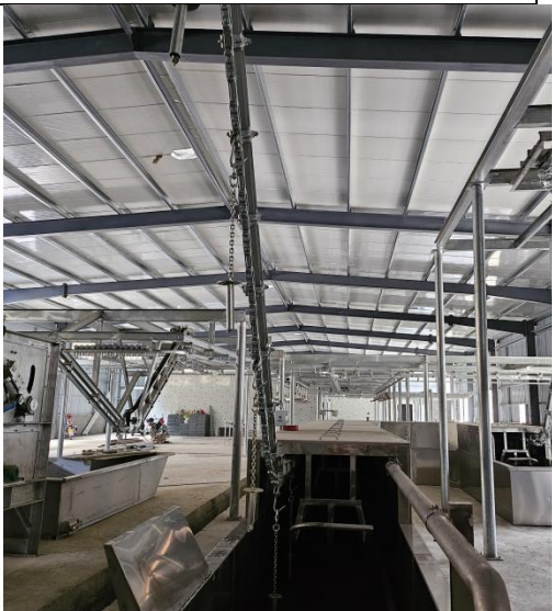
已建屠宰车间（内部）