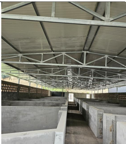
已建待宰车间（内部）