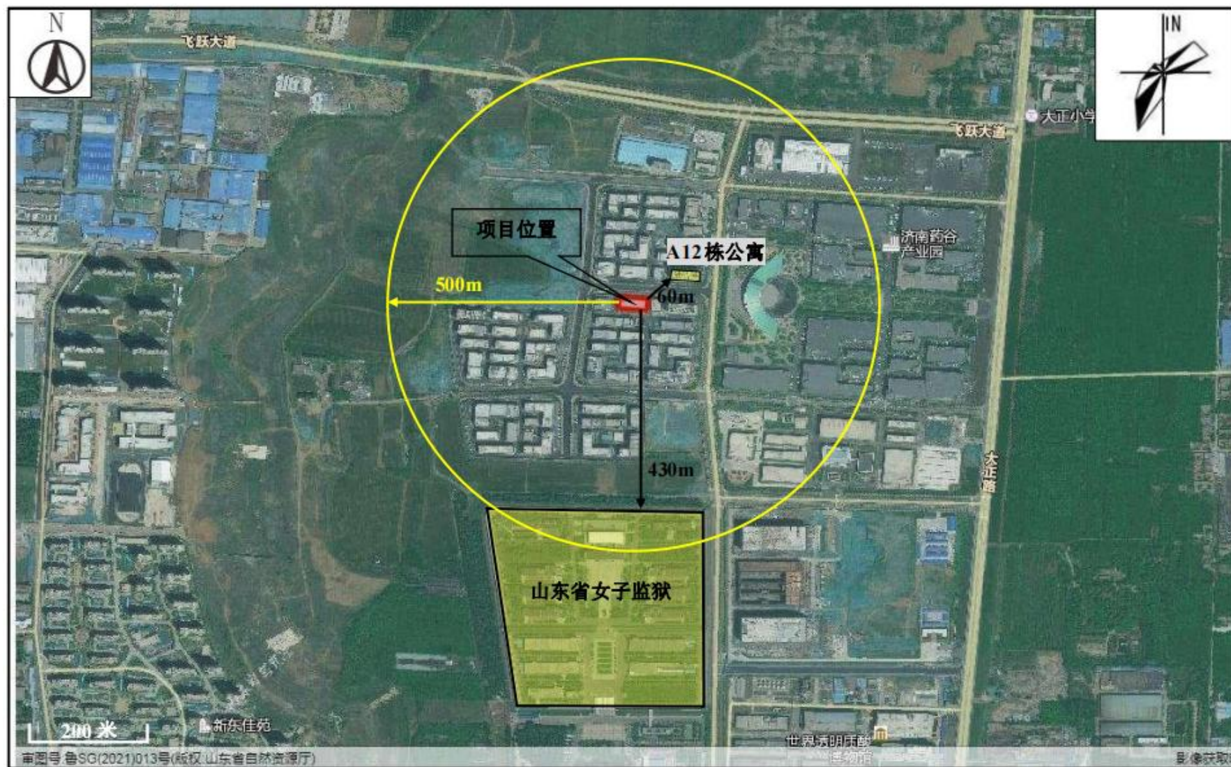
附图2 项目周边情况图