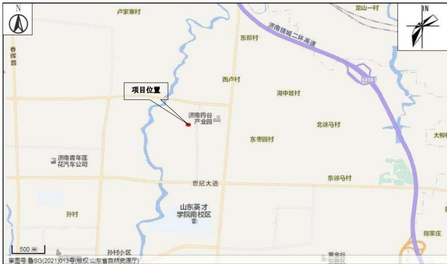
附图1 项目地理位置图