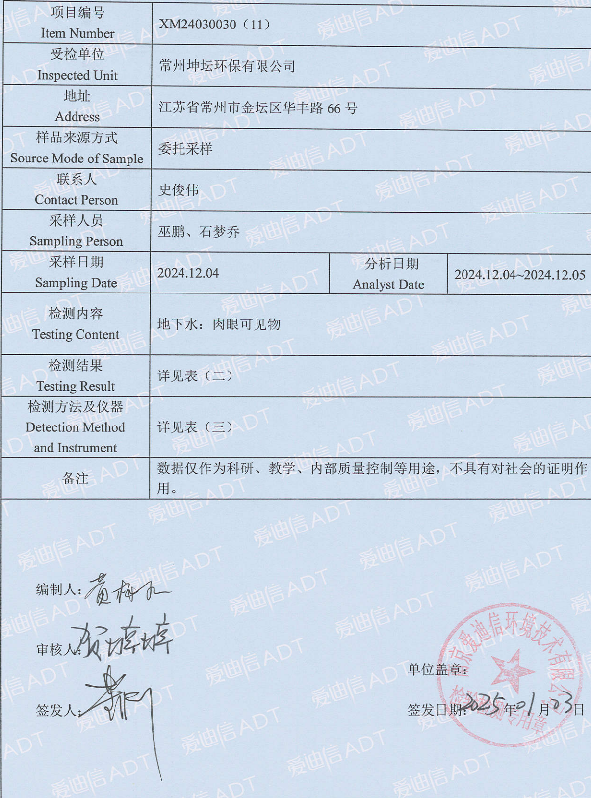
表 (一) 项目概况说明