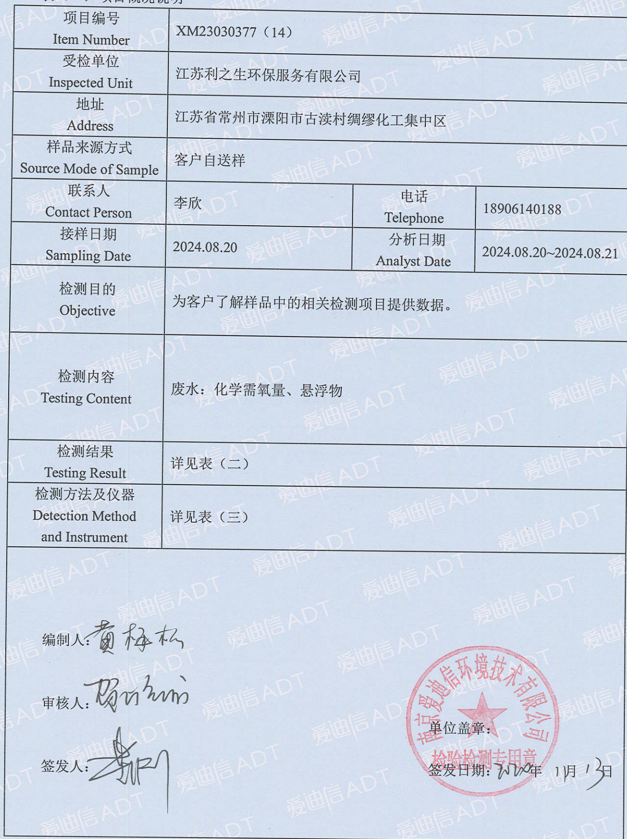
表 (一) 项目概况说明