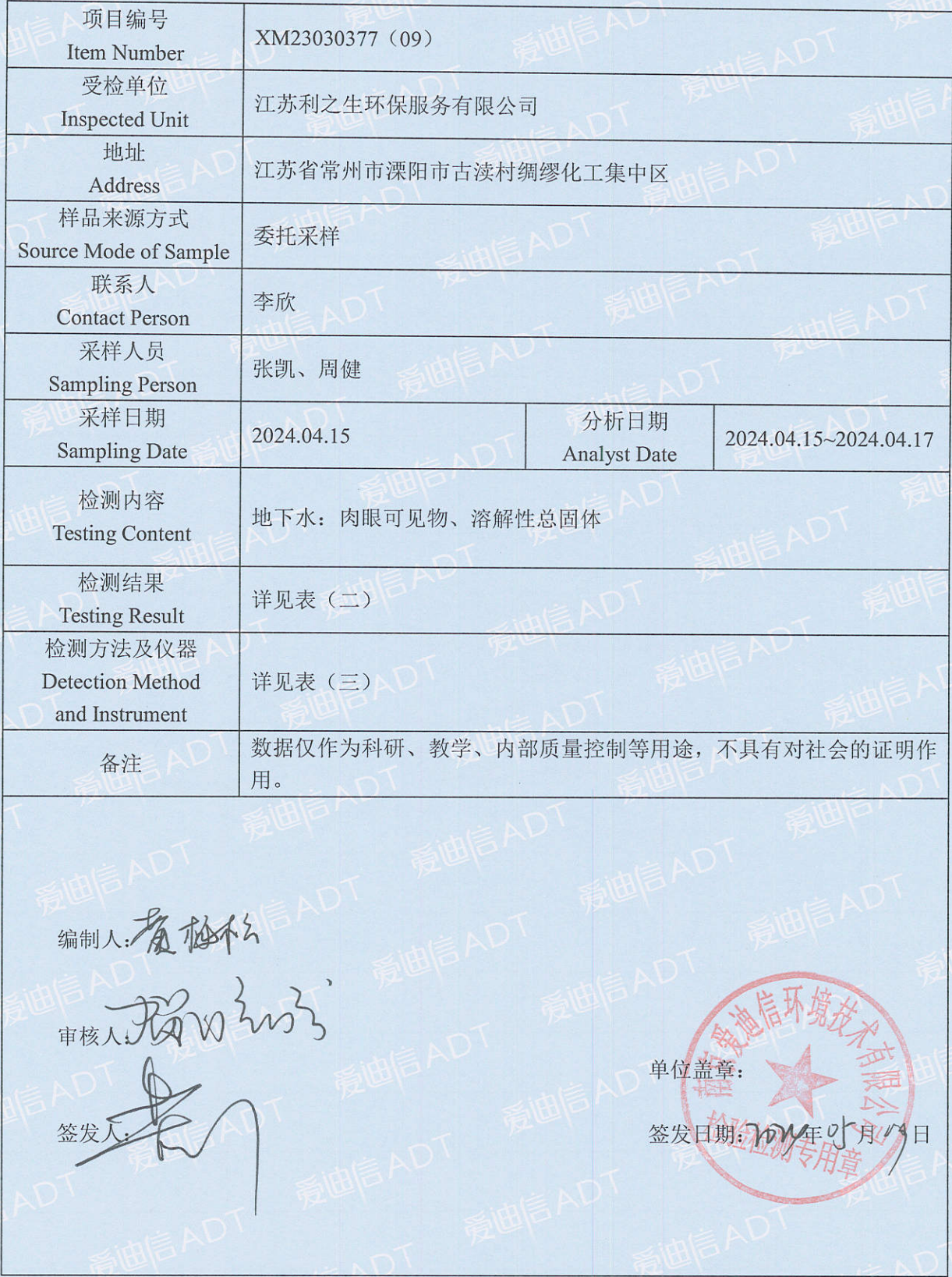
表 (一) 项目概况说明