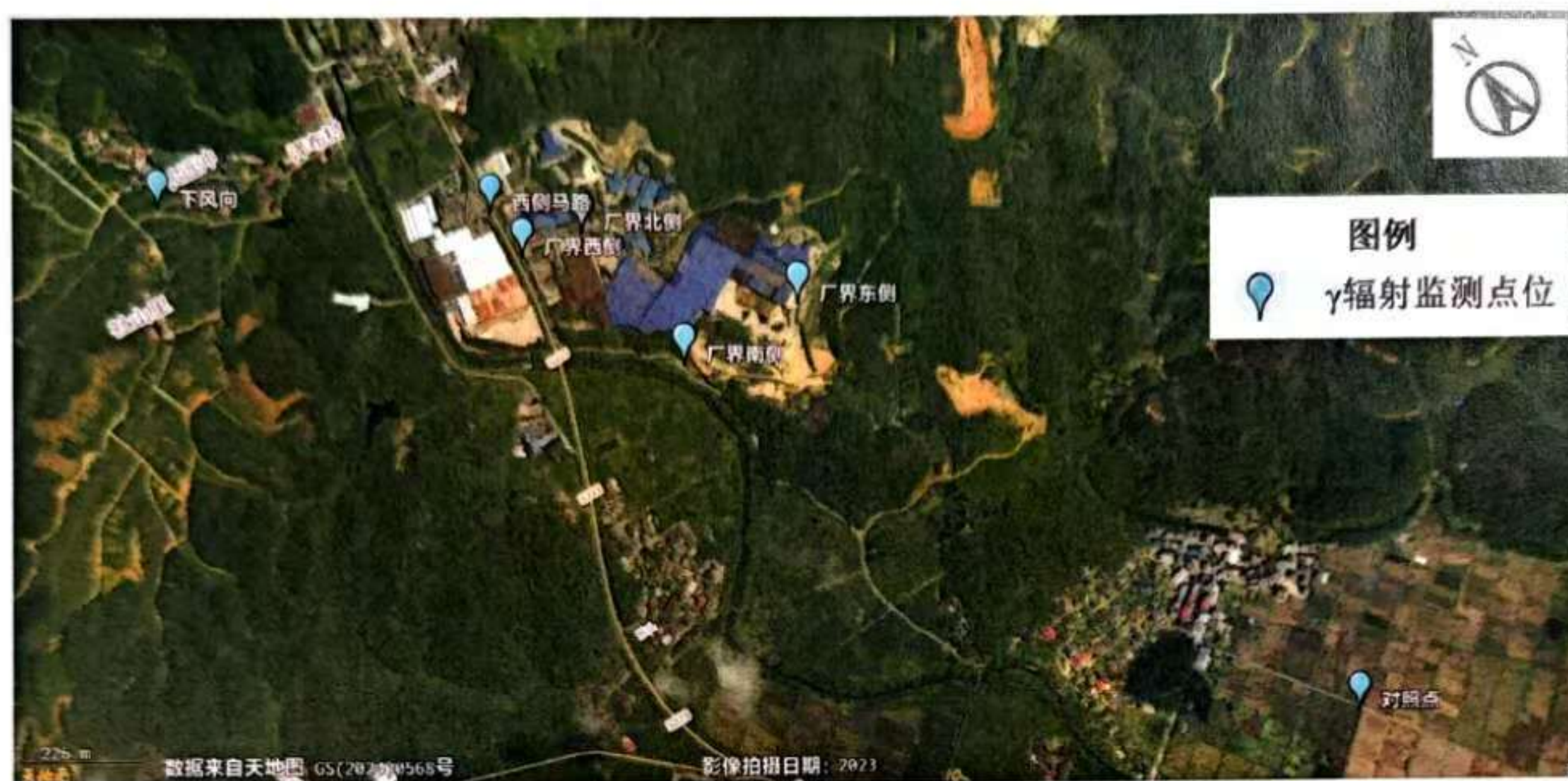
图1 γ辐射空气吸收剂量率监测点位示意图