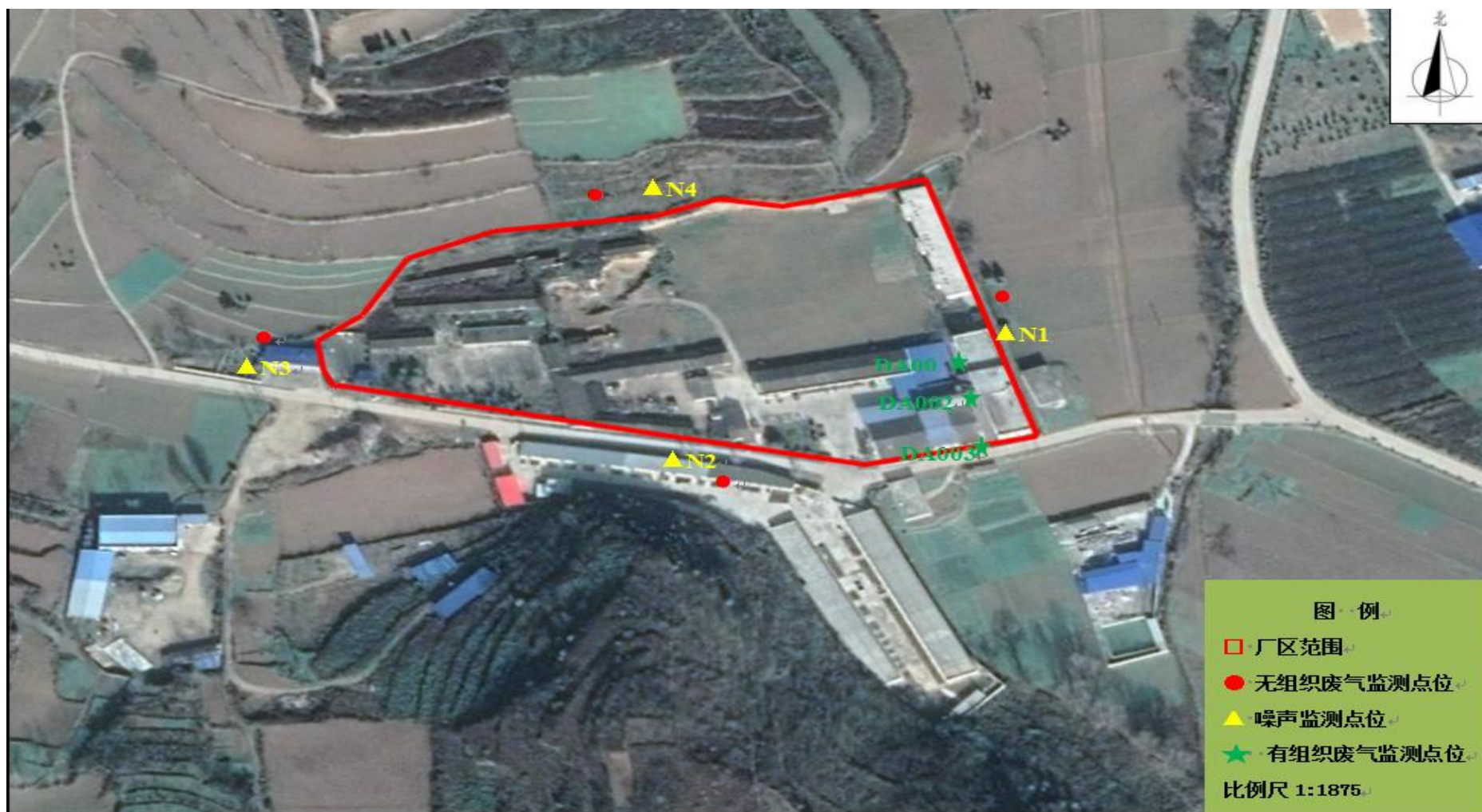
图 5 项目监测点位布设图