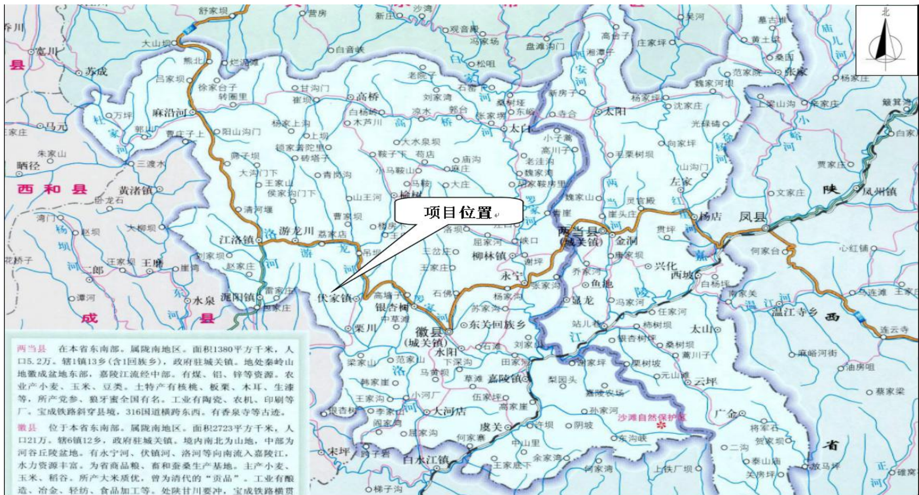
图1 项目地理位置图