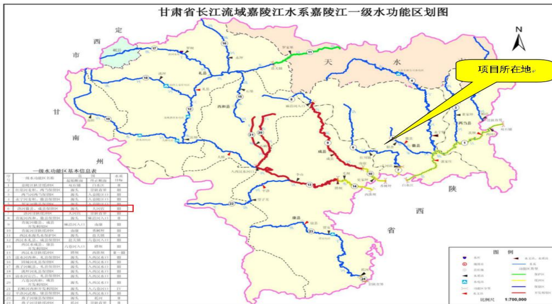
图 2 项目水功能区划图