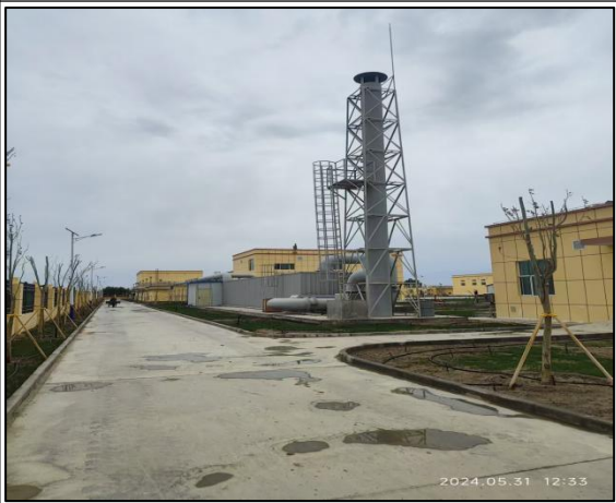
生物除臭装置废气排气筒