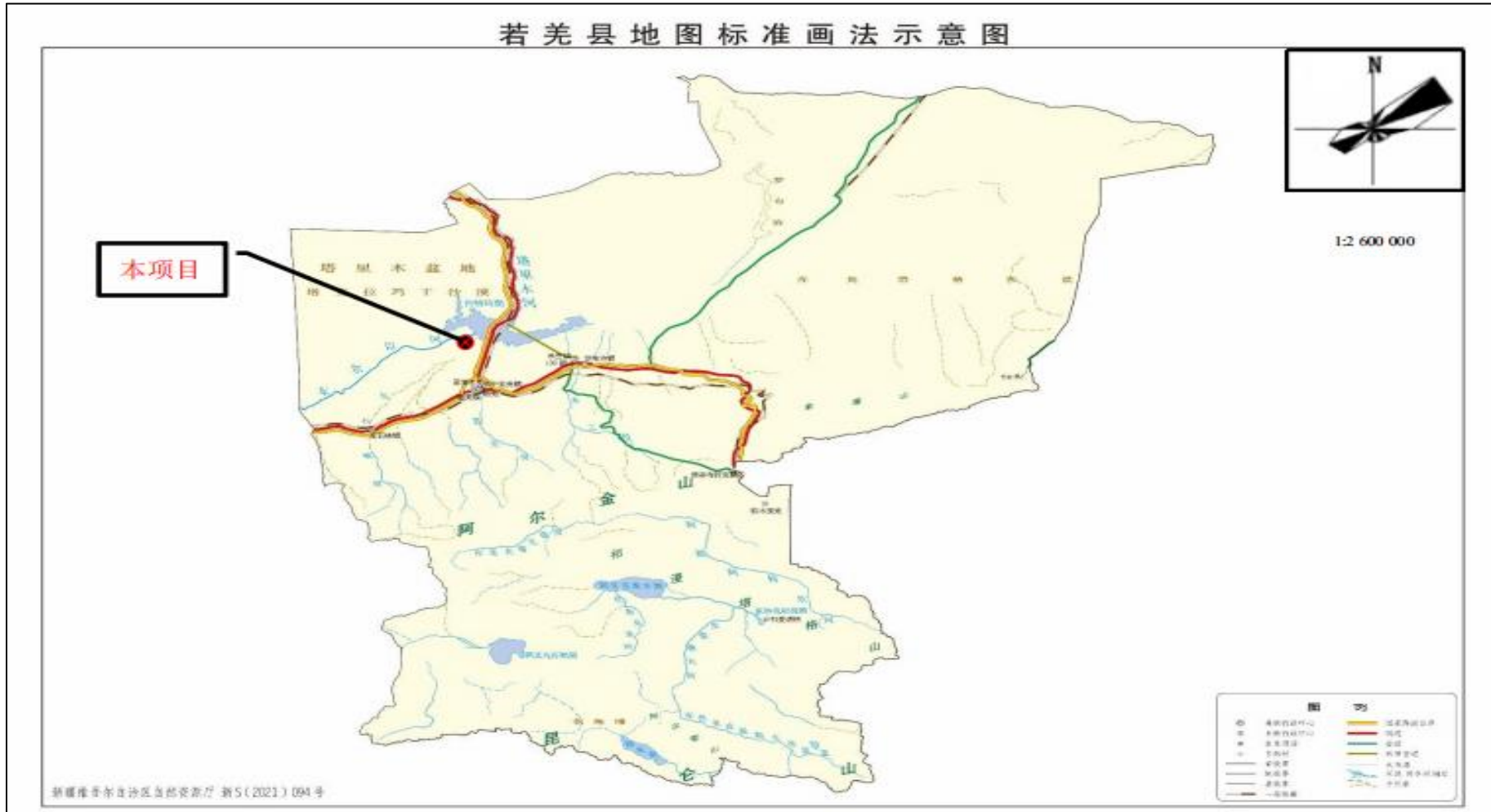
附图 1 项目区地理位置图