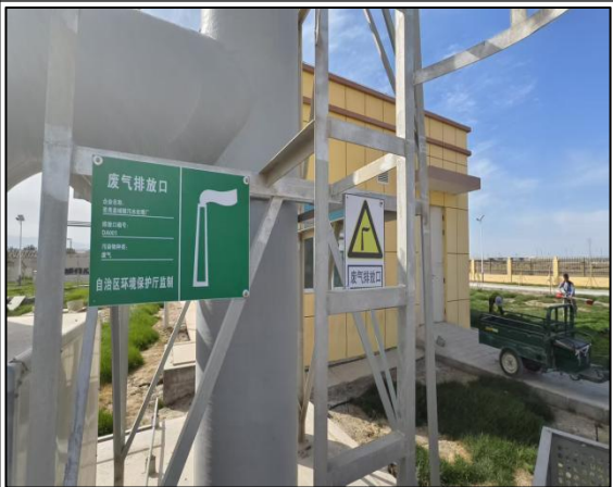
废气排放口标志标识