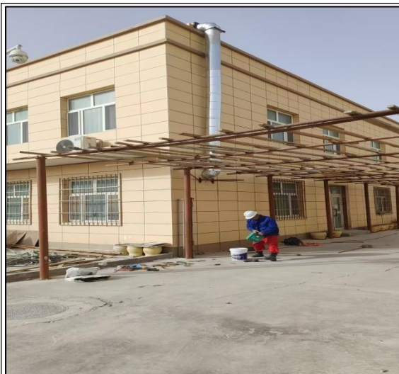
油烟净化装置排气筒