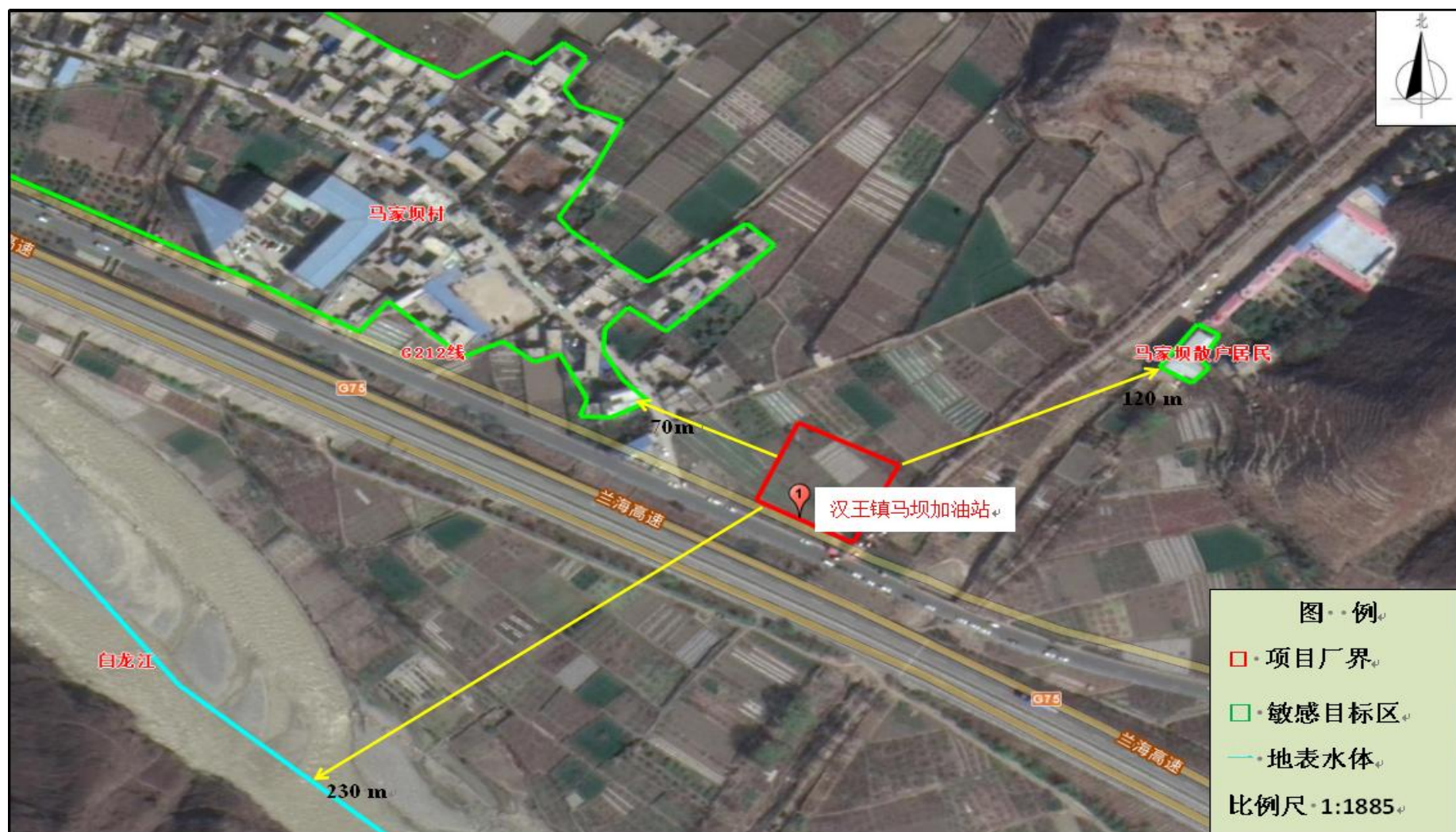
图 4 环境保护目标分布图