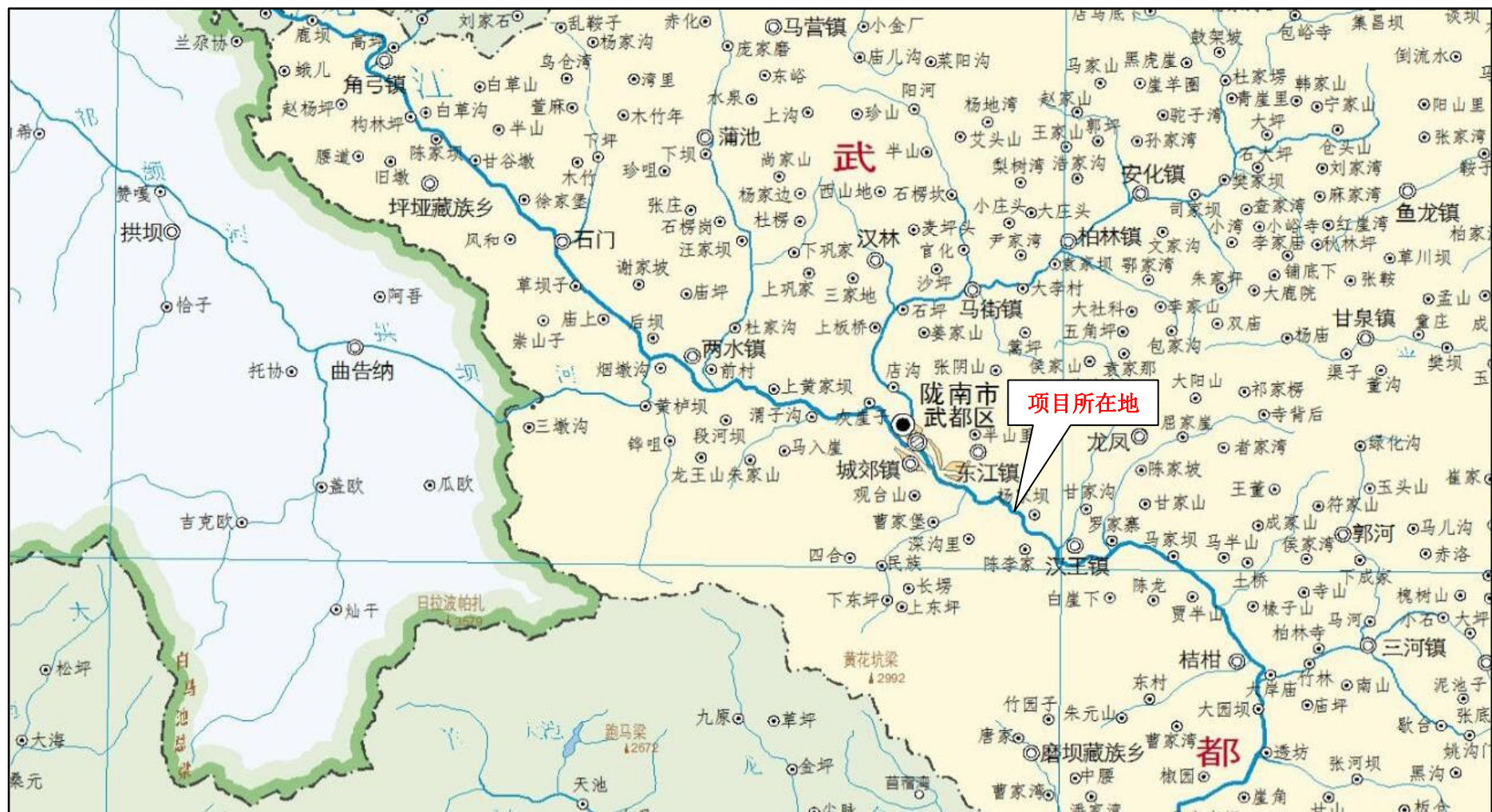
图 1 项目地理位置图