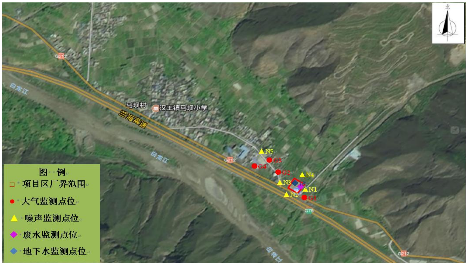
图 5 环境质量监测点位布设图