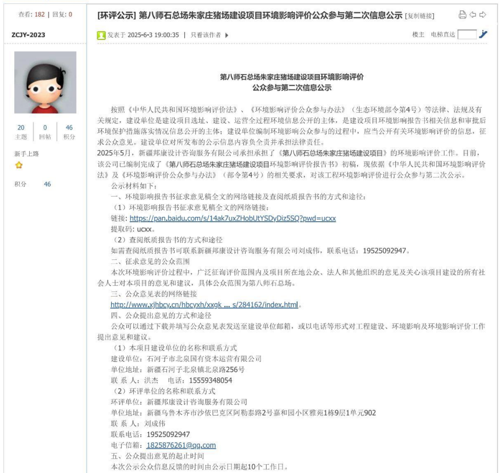
图3.2-1环境影响评价公众参与第二次信息公示网页截图 (2) 报纸公示

根据《环境影响评价公众参与办法》第十一条中“通过建设项目所在地公众易于接触的报纸公开，且在征求意见的10个工作日内公