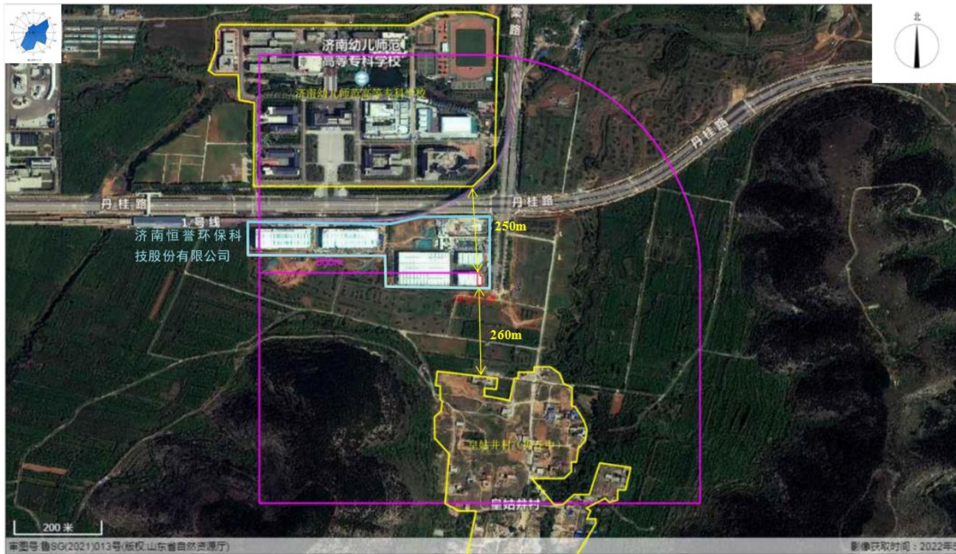
附图2 项目周边情况图