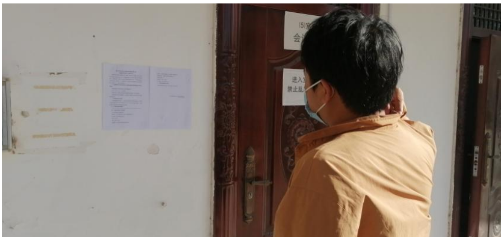
图 3.2-4 公告照片