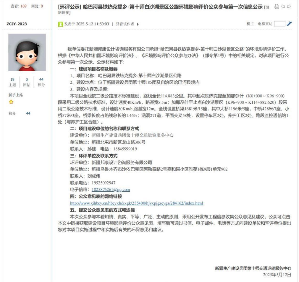
图 2-1 环境影响评价第一次公示网页截图