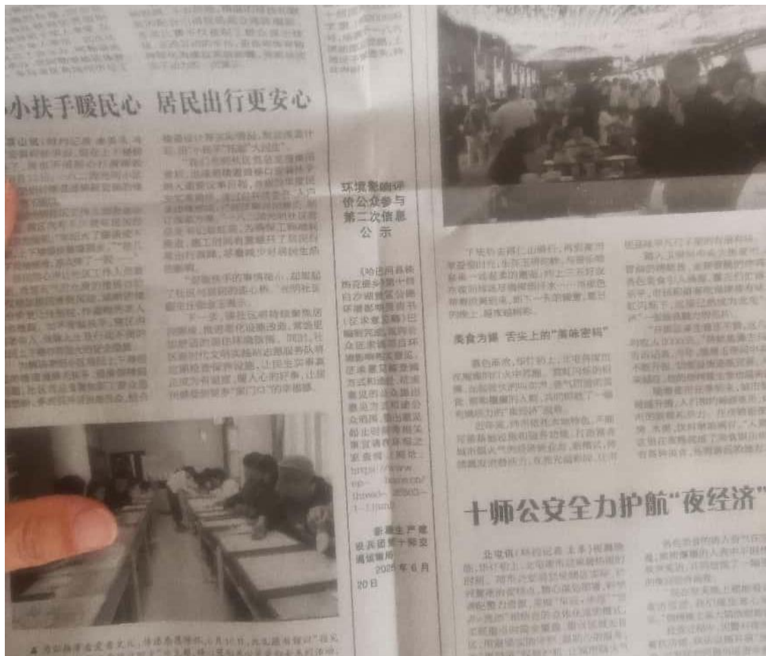
图 3.2-3 2025 年 6 月 20 日报纸公示