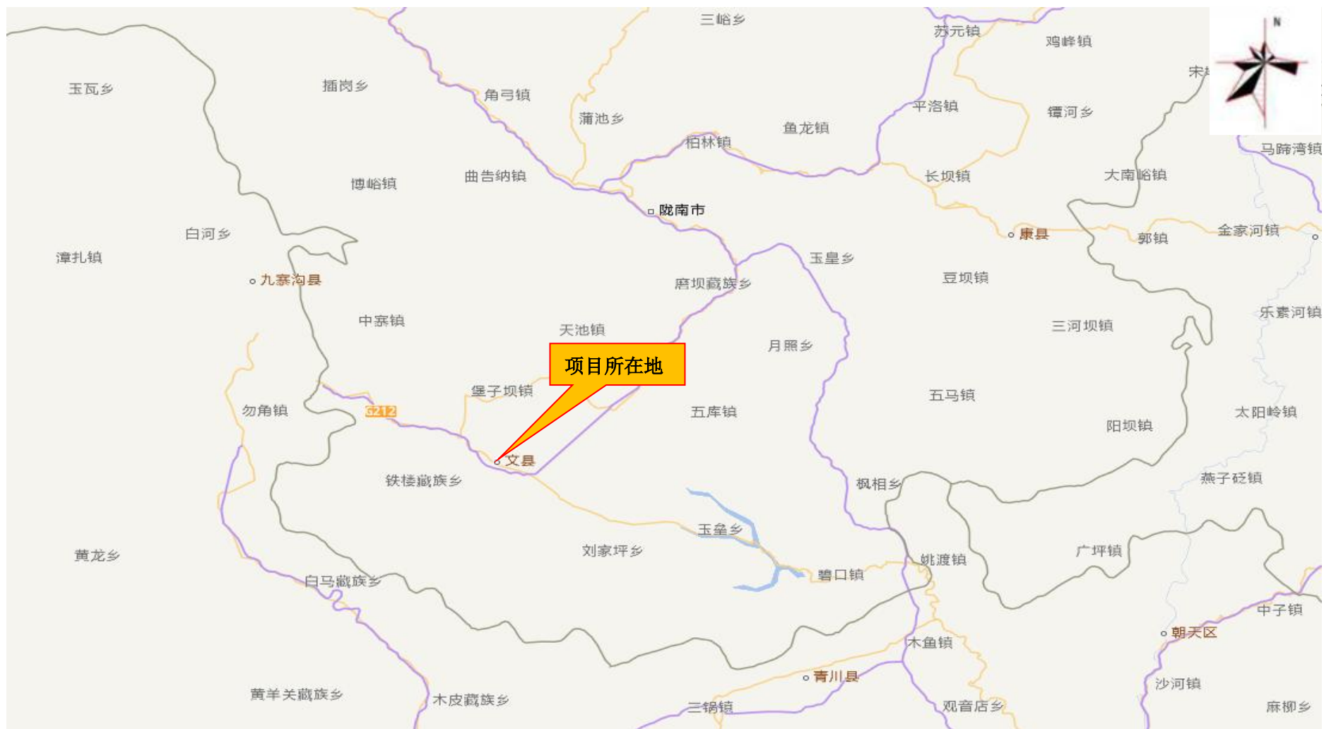
图 1 地理位置图