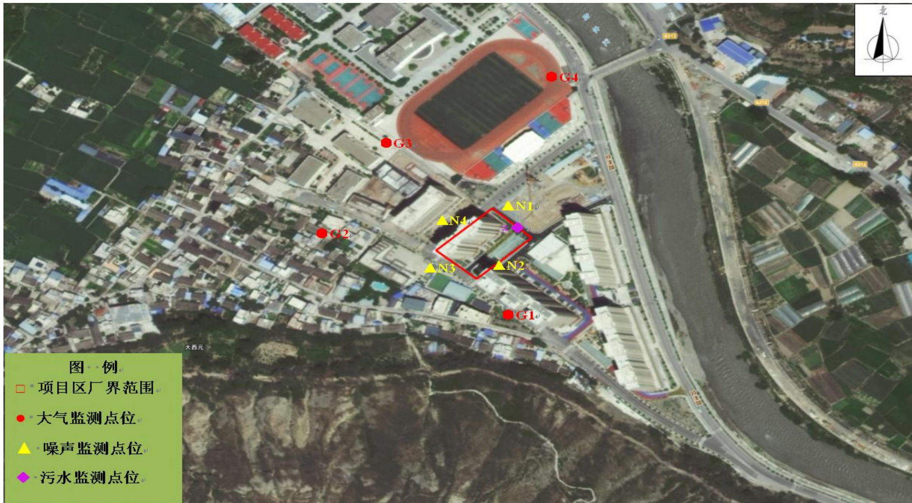
图4 监测点位布设图