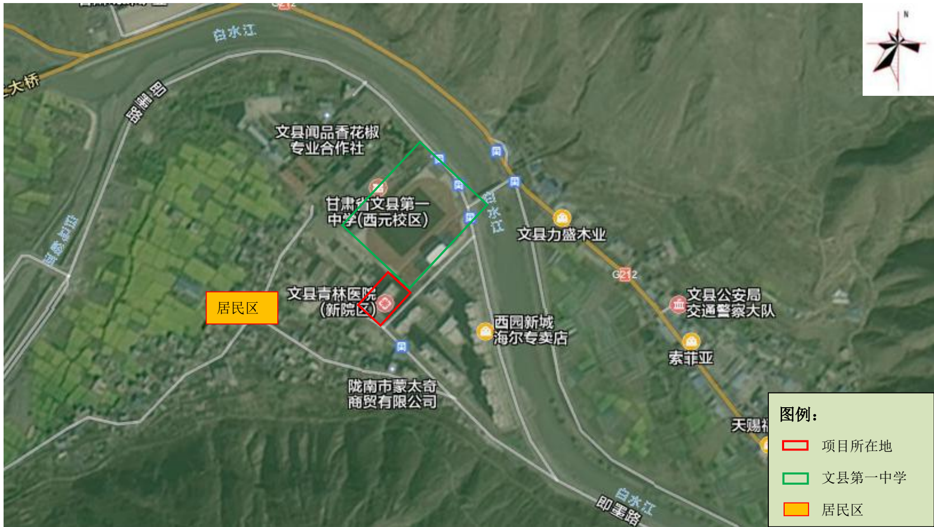
图 2 四邻关系图