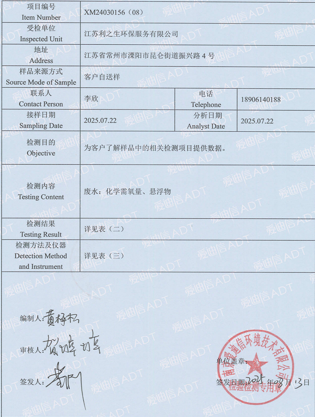
表 (一) 项目概况说明