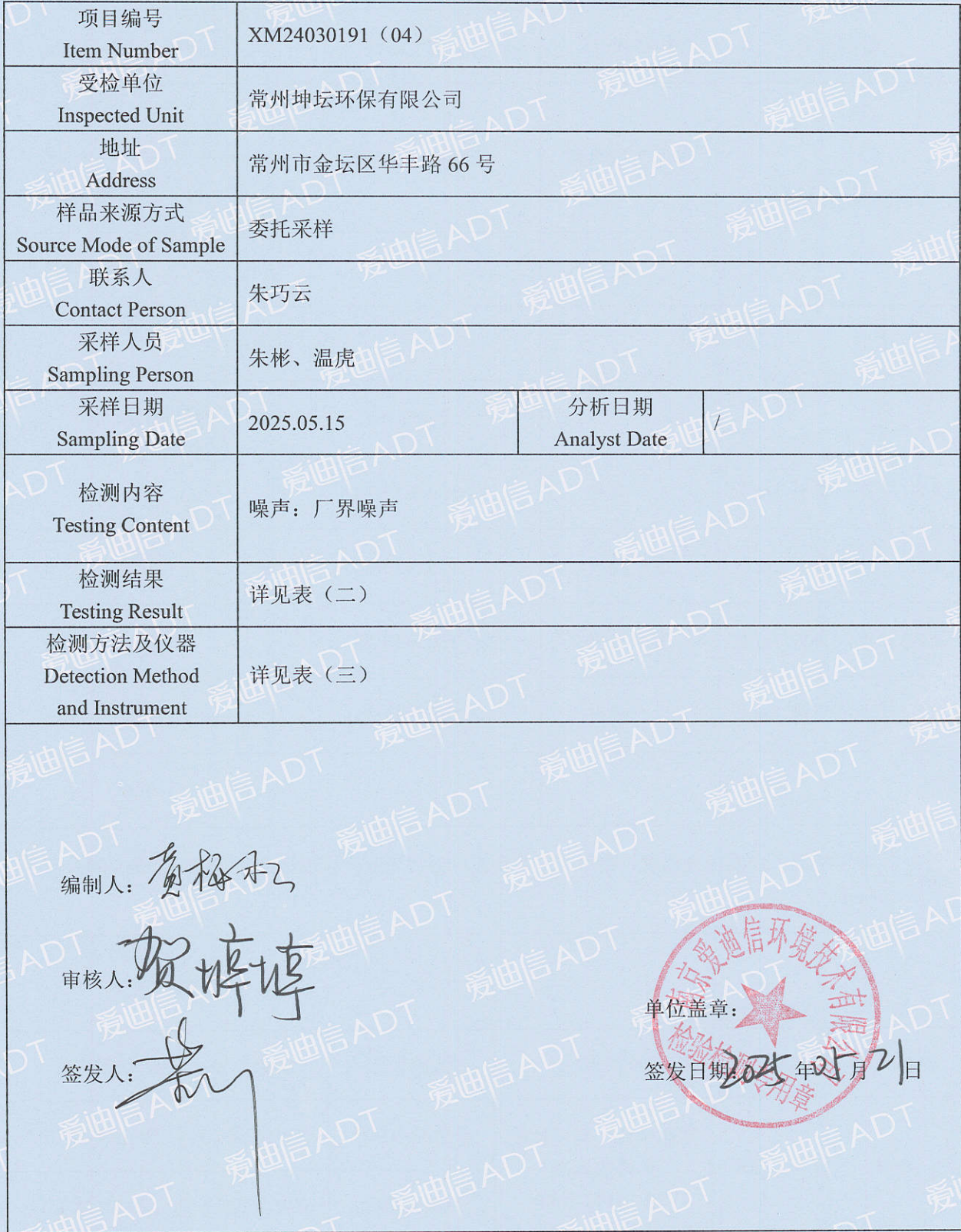
表 (一) 项目概况说明