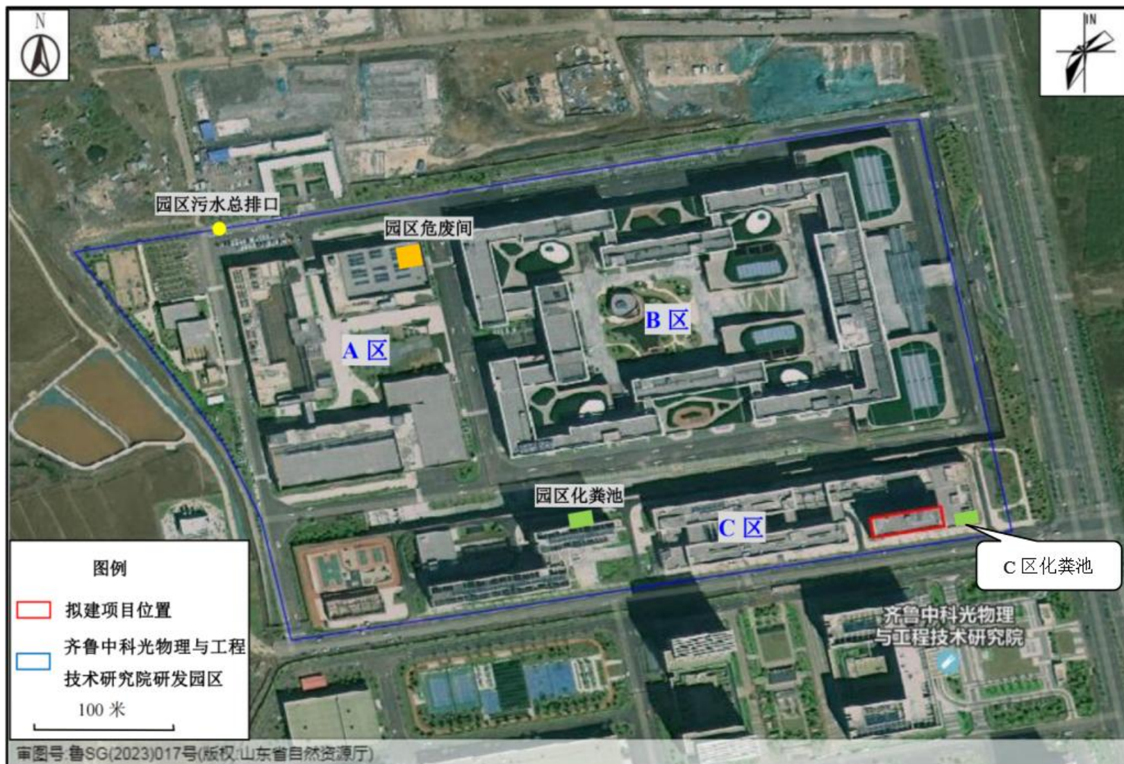
附图3-1 项目园区平面布置图