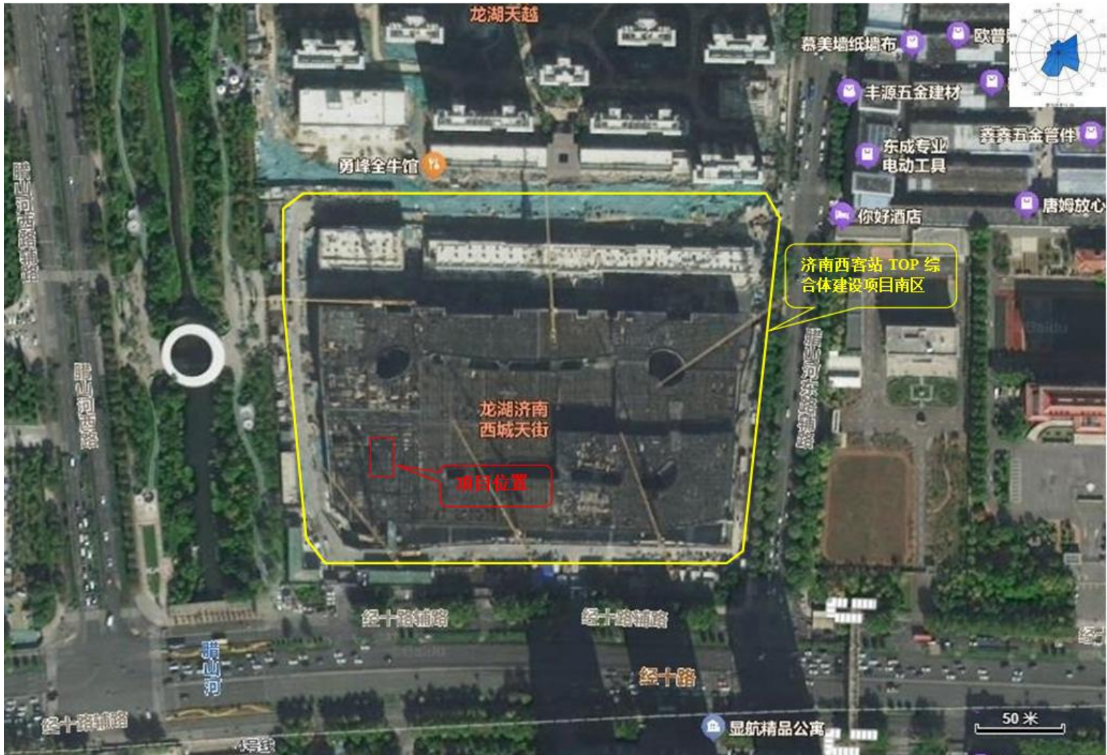
附图3-1 项目平面布置图