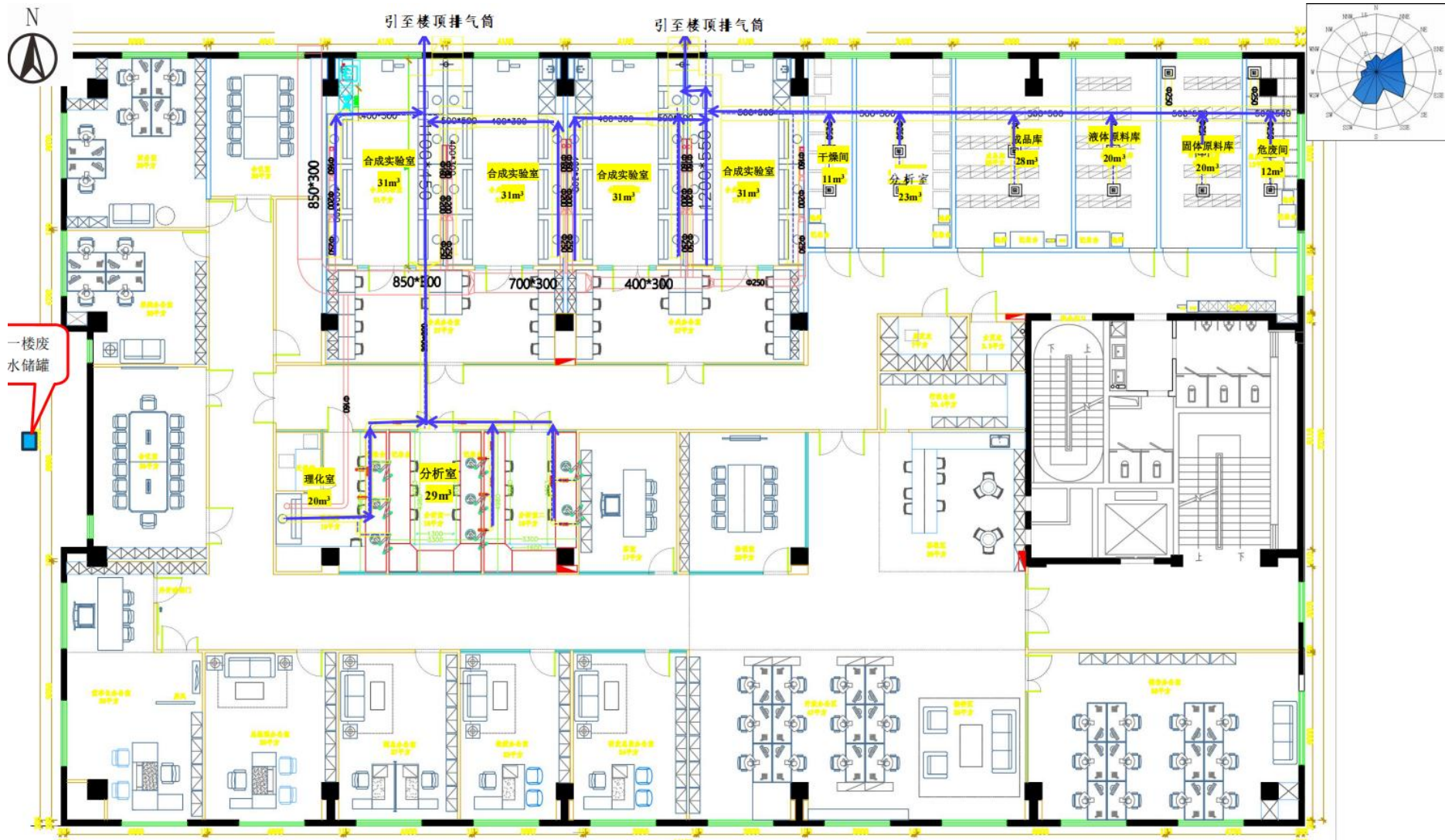
附图4 项目废气走向图