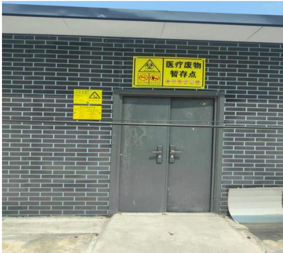
依托的医疗危废间