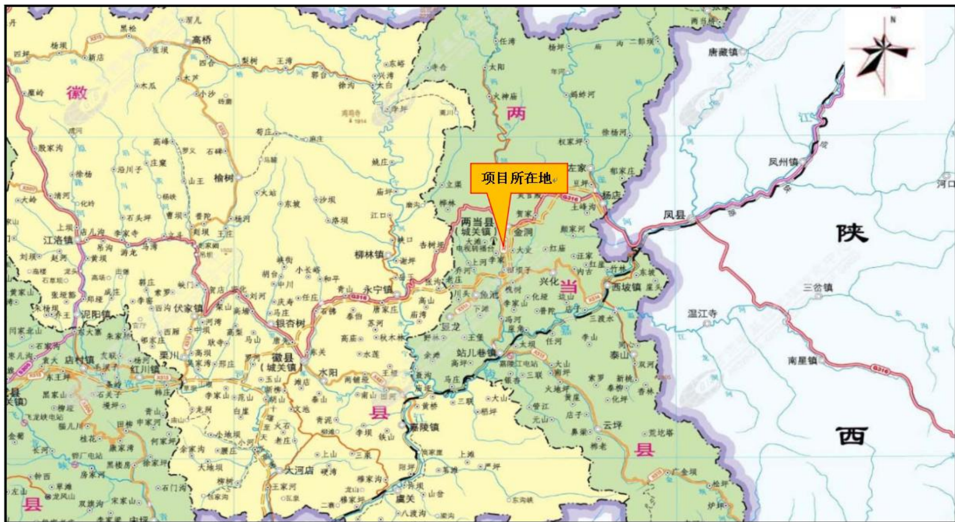
图 1 地理位置图