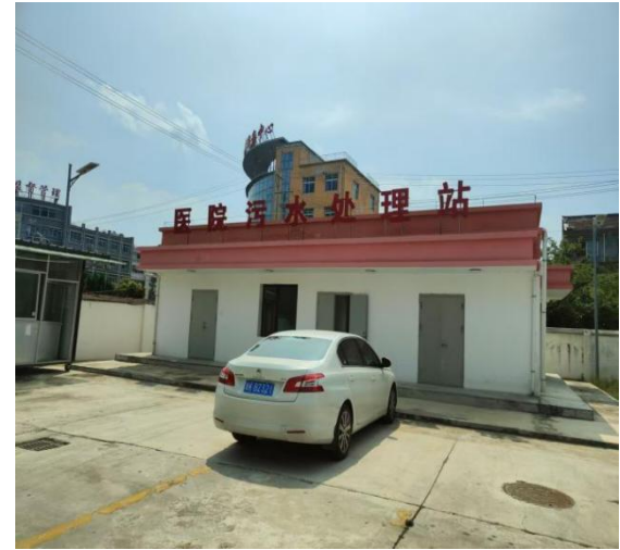
污水处理站加药间