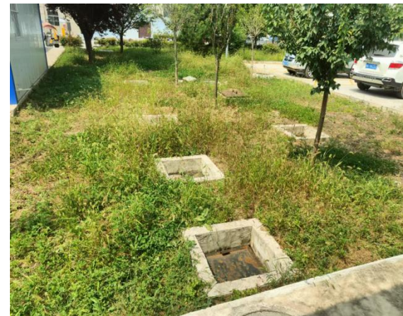
地埋式一体化污水处理设施