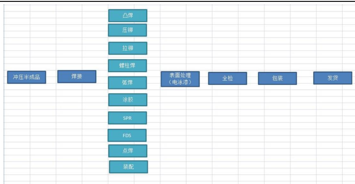
图 2-3 本项目后道机加工工艺流程及产污环节图