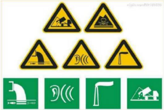
图4-3标准化排污口标志图

对厂内多种固体废物，应设置专用的临时贮存设施或堆放场地，并做好安全防护工作，防止发生二次污染。厂内临时贮存或堆放的场地应设置环保图形标志牌，做好防扬散、防流失、防渗漏、防雨的工作。