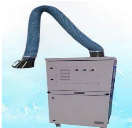
图 4-1 单臂移动式焊接烟尘净化器设备图