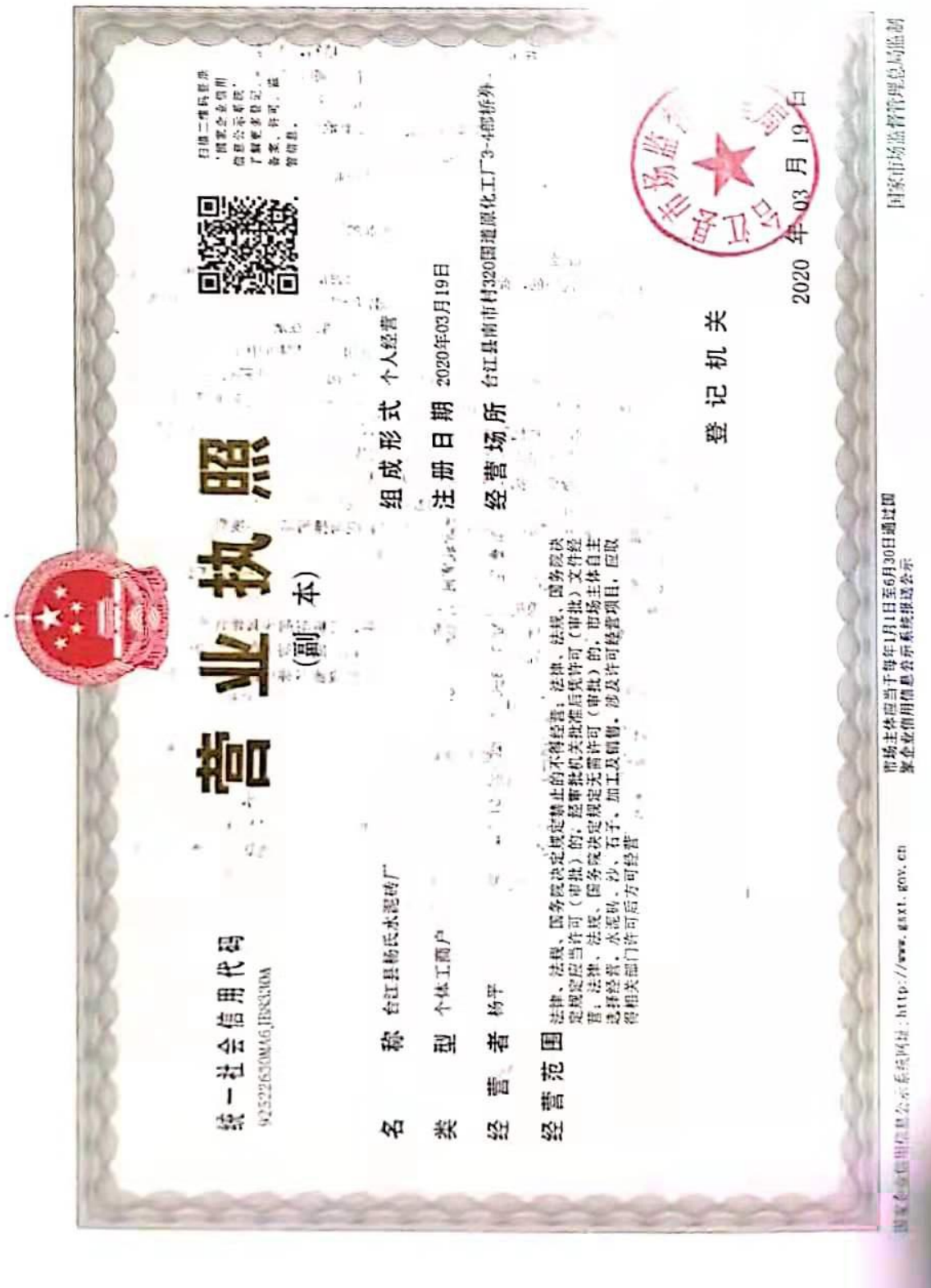
附件 2 营业执照