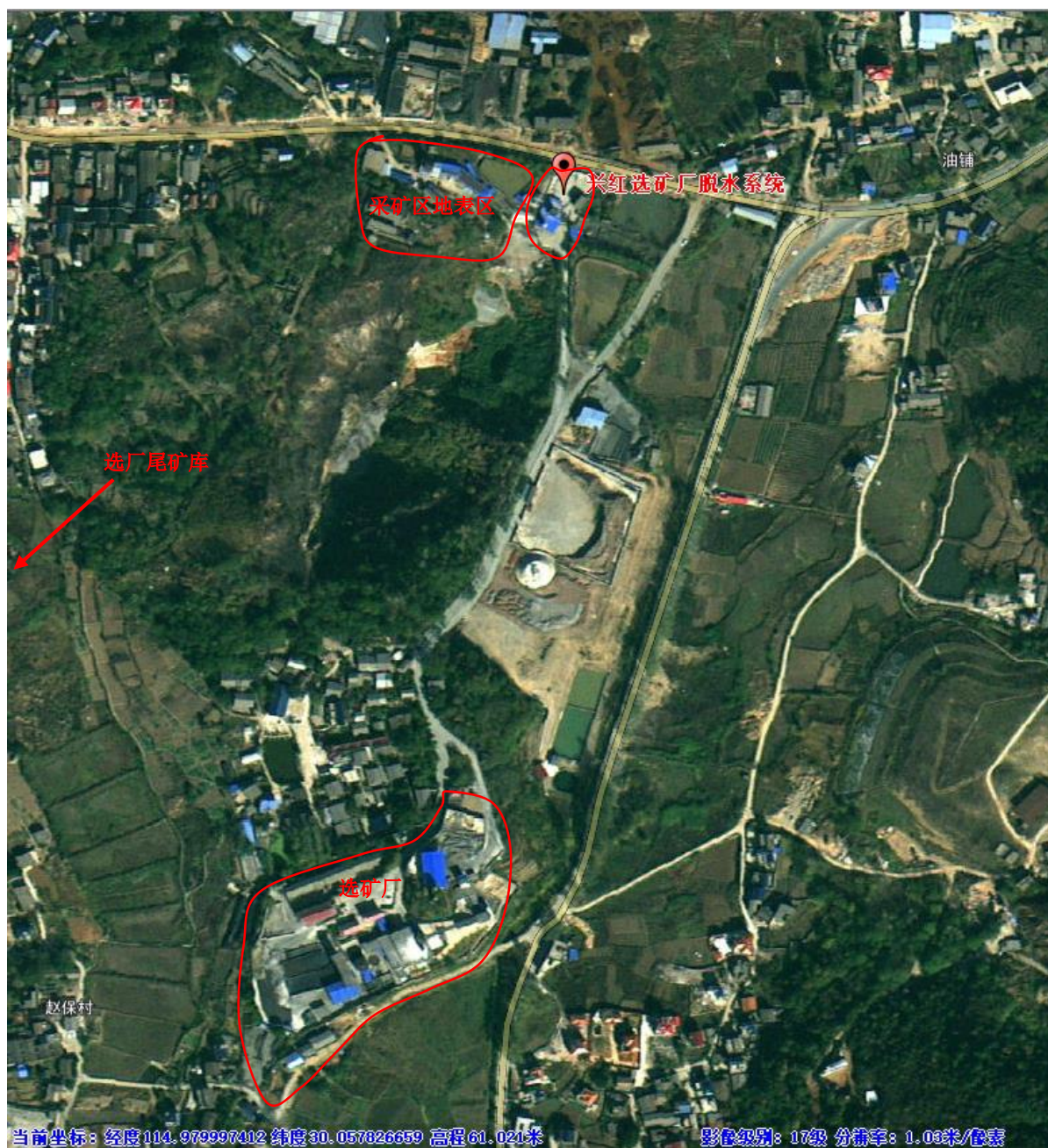
图二 脱水系统位置图