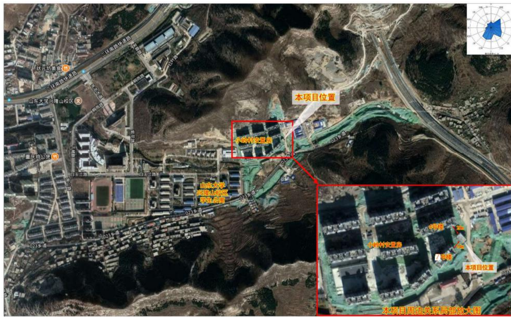
附图2 项目周边敏感目标分布图