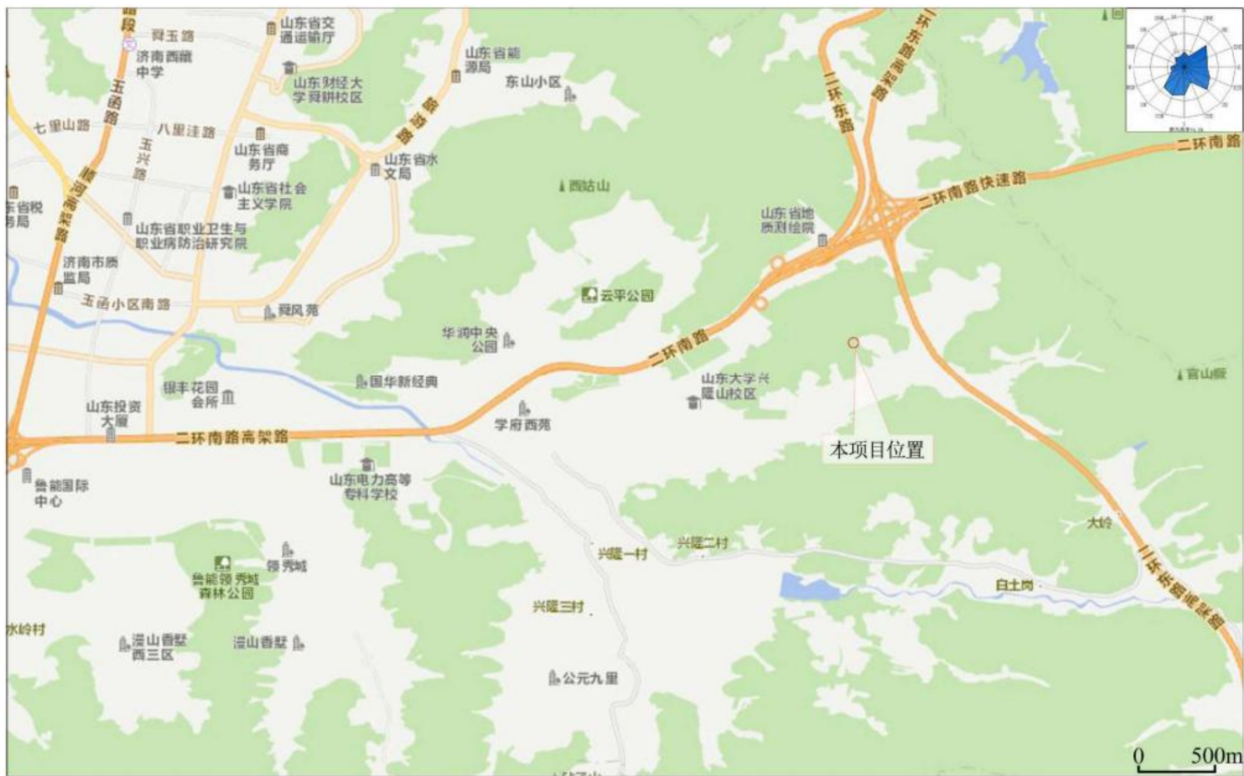
附图1 项目地理位置图