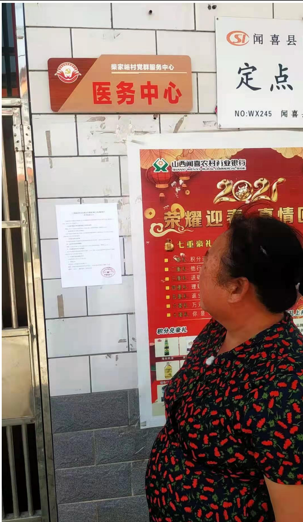
柴家峪村张贴公示