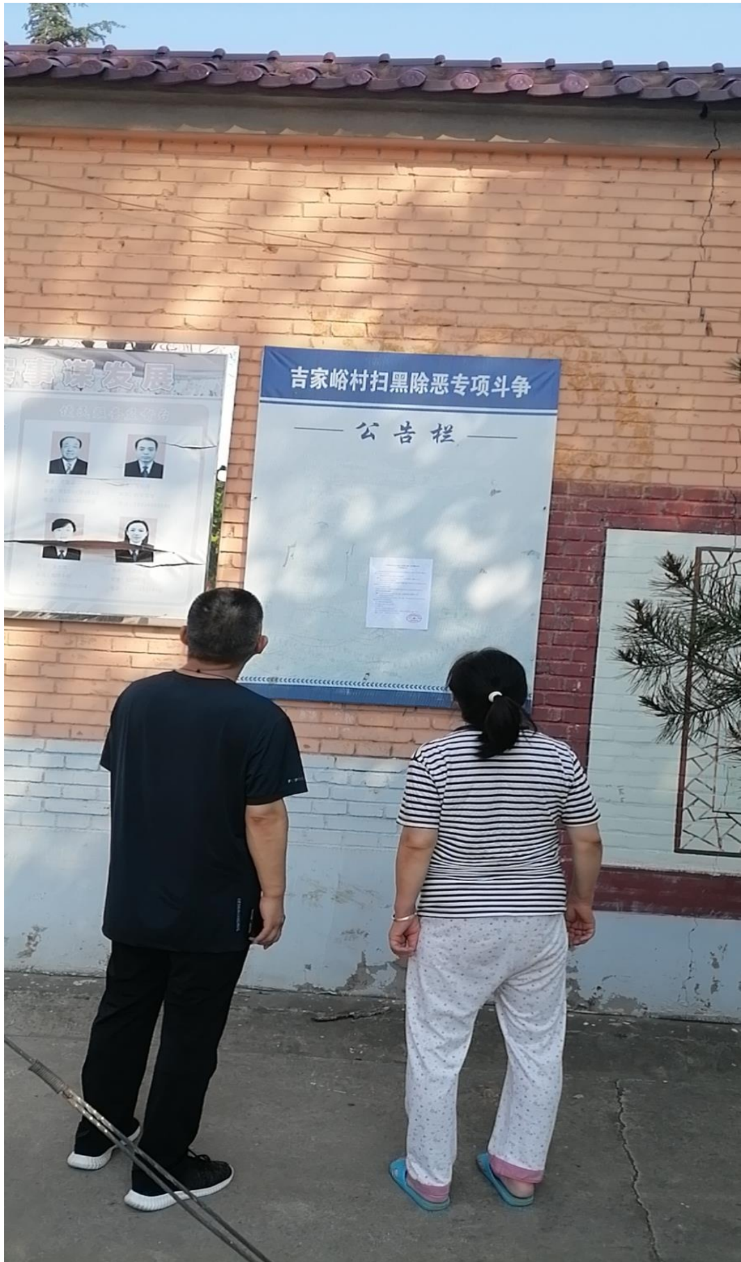
吉家峪村张贴公示