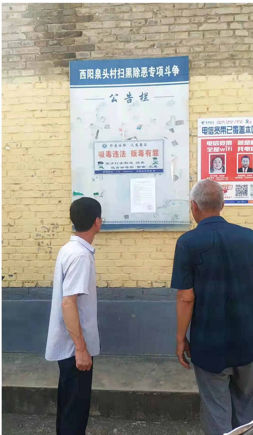
西阳泉头村张贴公示