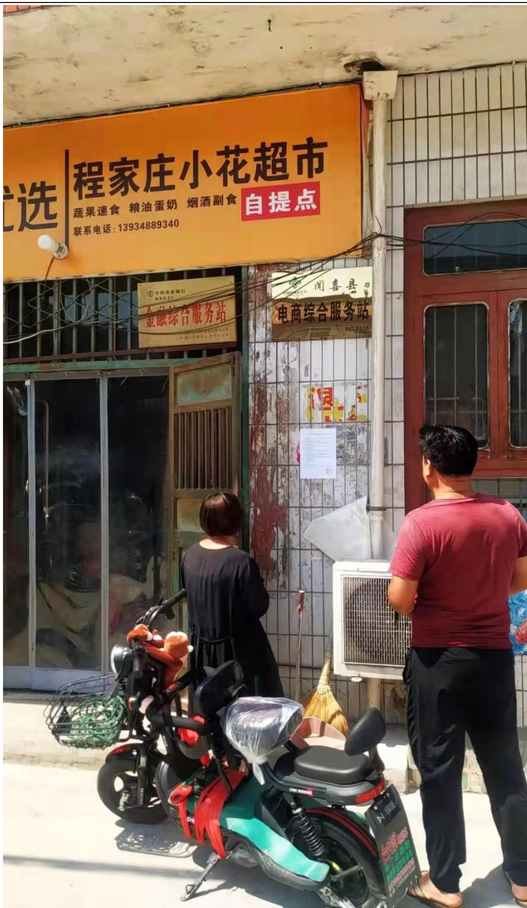
程家庄村张贴公示