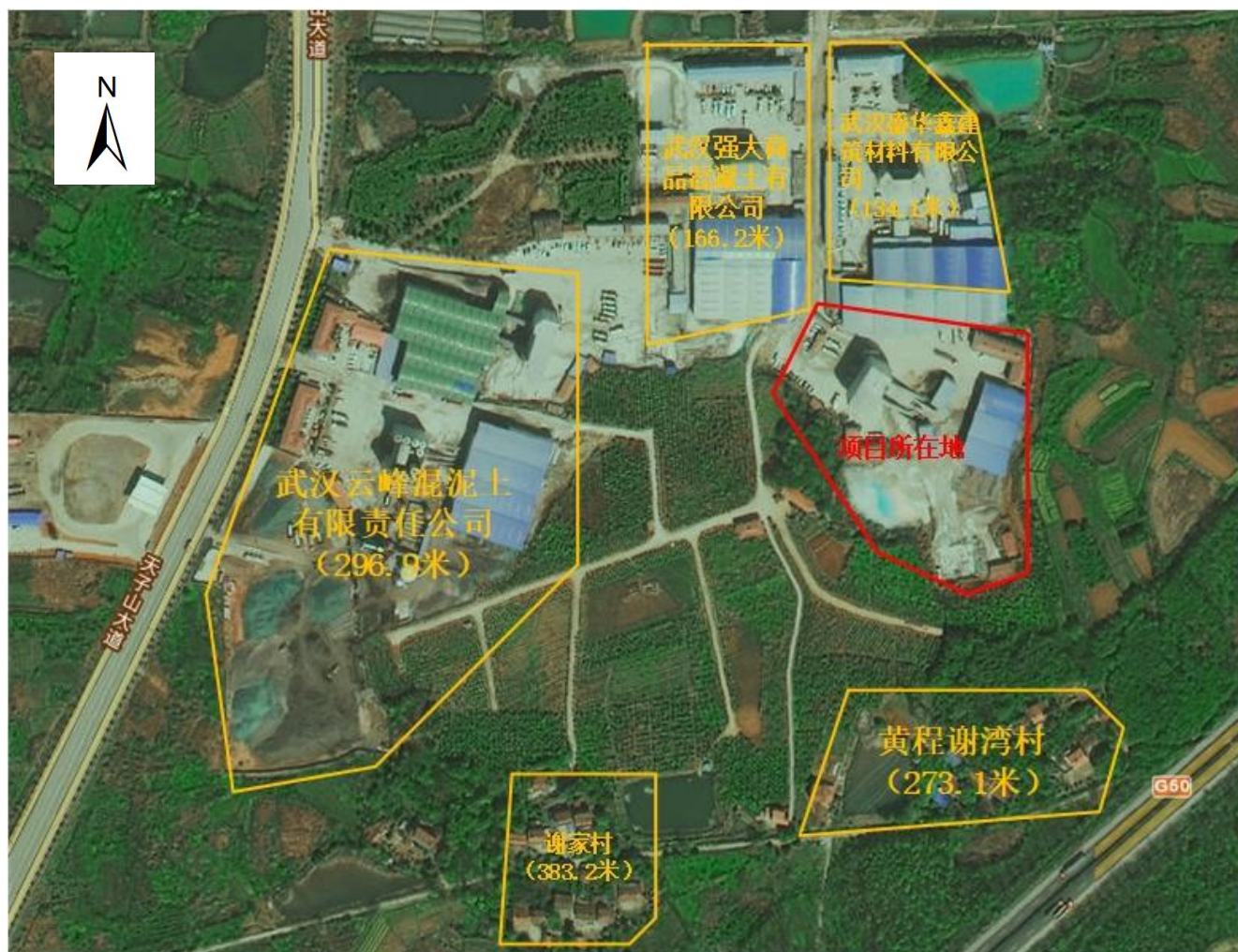
附图 1 项目周边关系图