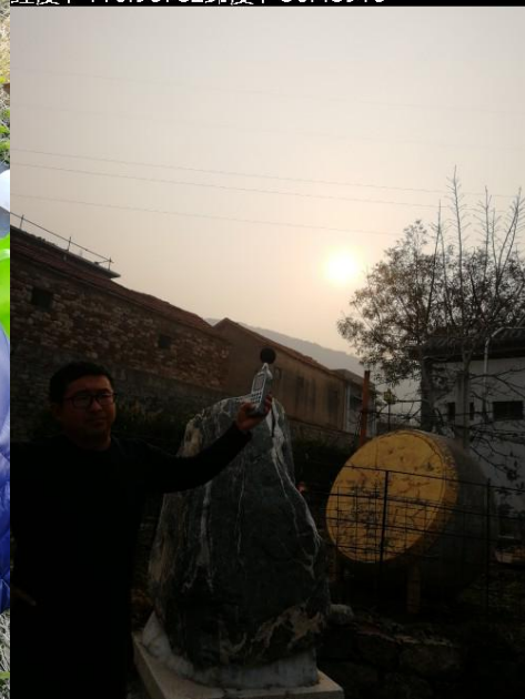
附图 4 现场监测照片

2021-11-19 14:49:10 经度：116.95782纬度：36.48915