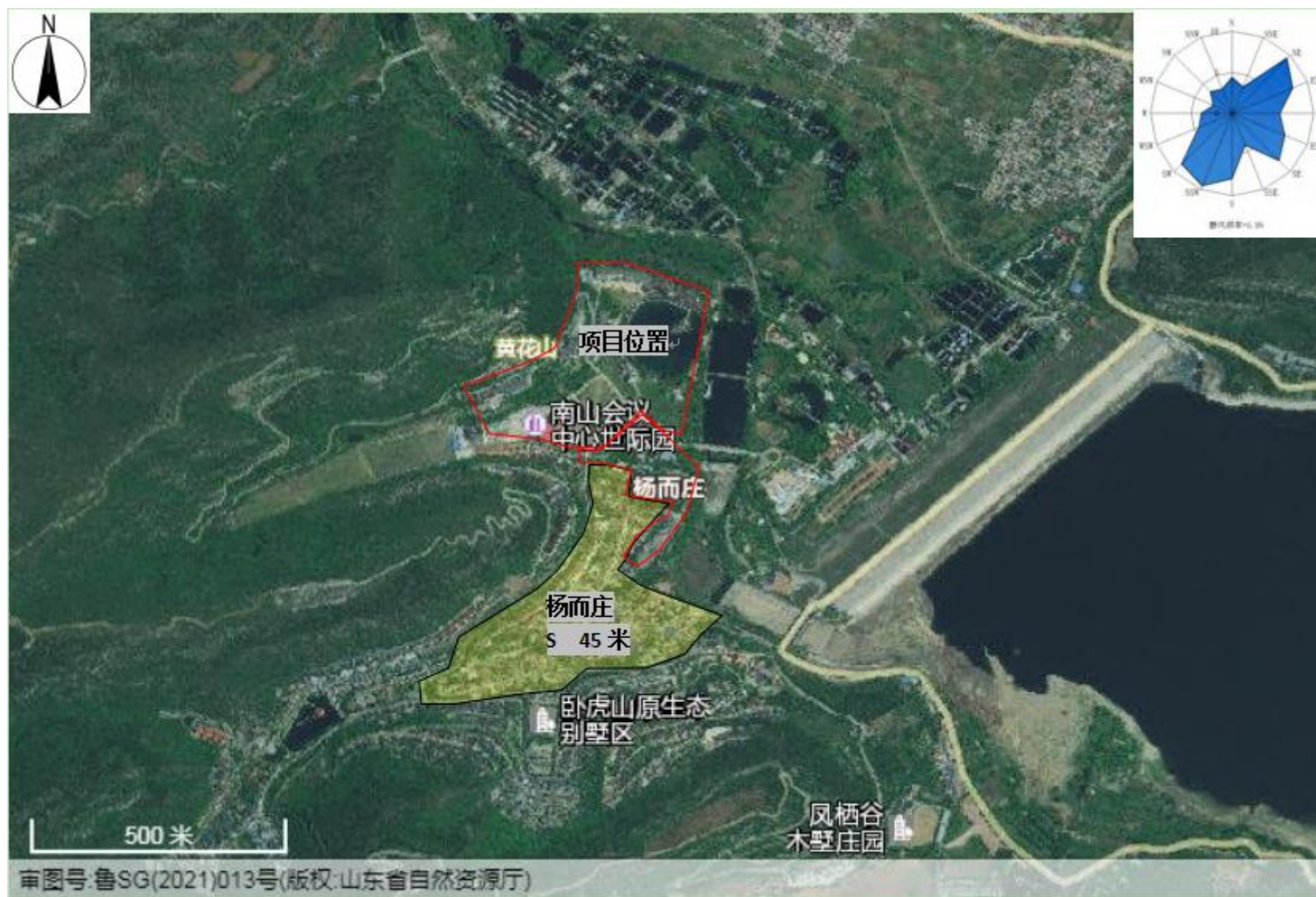
附图 2 项目周围敏感目标分布图