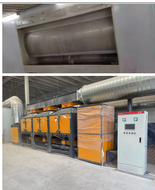
有机废气处理装置（东车间）