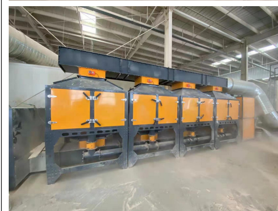
有机废气处理装置（西车间）