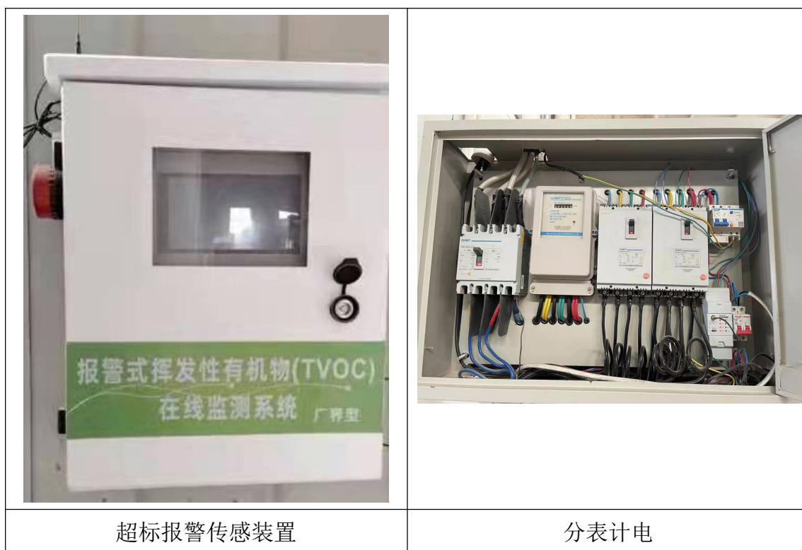
图 4-3 排污口、监测设施及在线监测装置