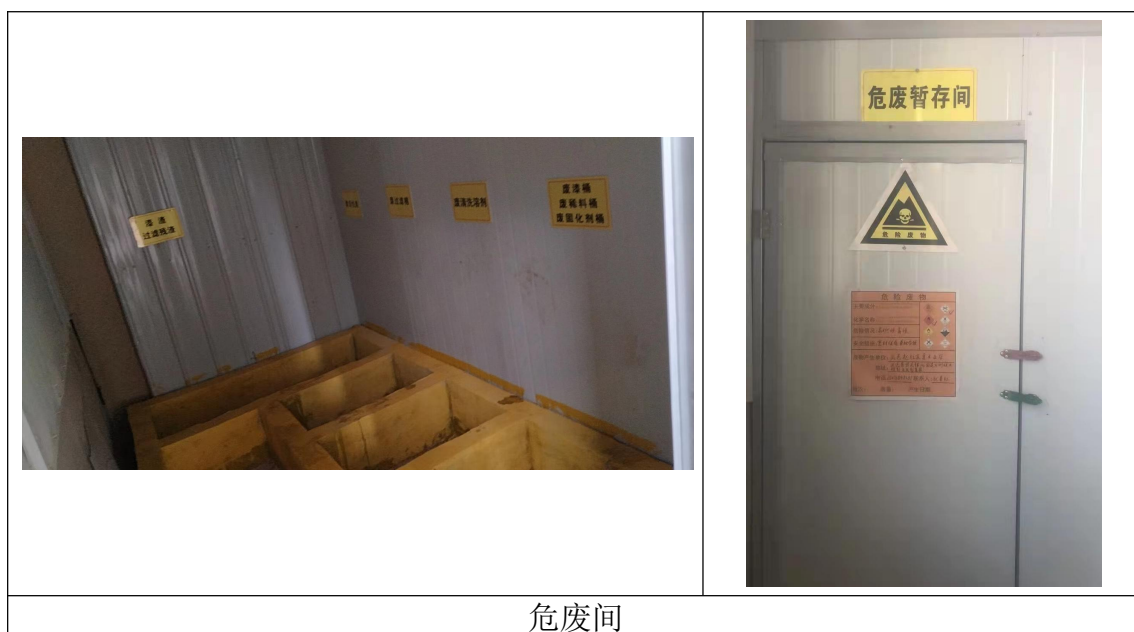
图 4-2 危废间