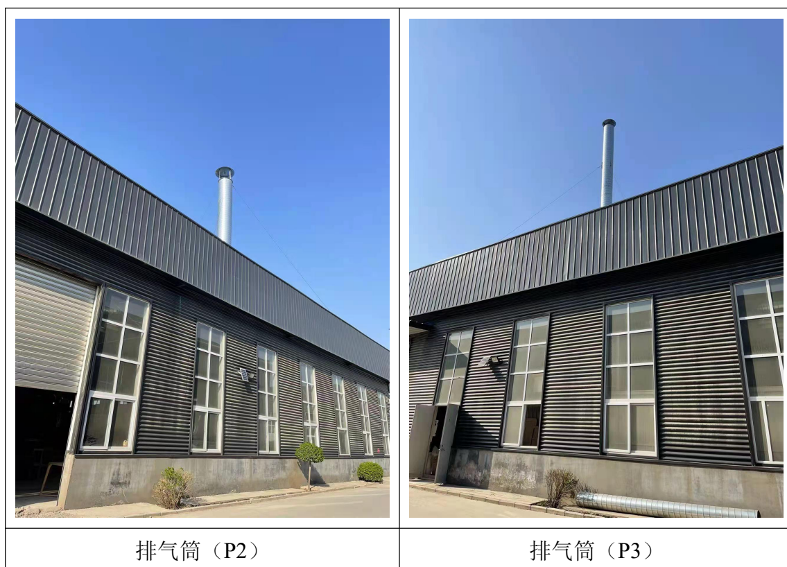
图 4-1 废气治理设施图片