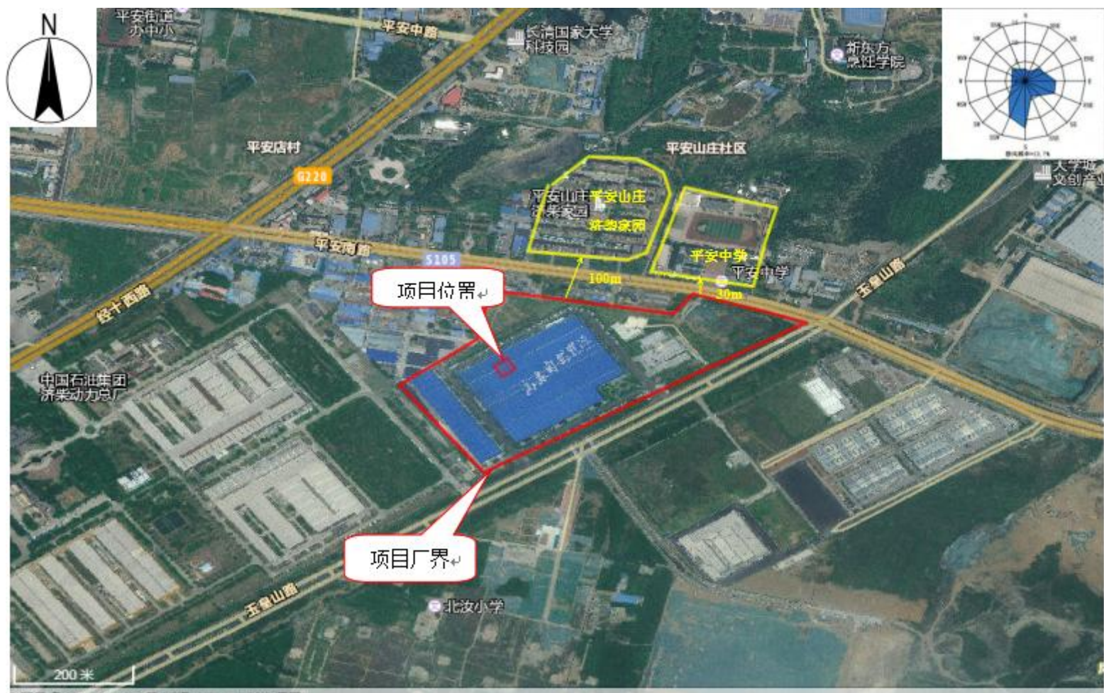
附图2 项目周边敏感目标分布图